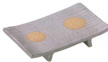
エ105-42-2 磁輪鉄丸紋 焼物皿 (約21.5×12×3.5cm) ¥2,700 1215100023