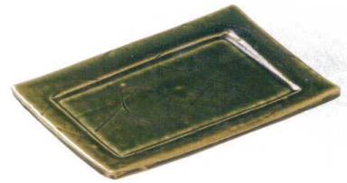
キ105-13-2 織部 焼物皿(手造り) (19.5×13.5cm) ¥3,300 1213103033