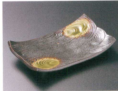
ル105-32-2 備前ヒフ吹 焼物皿 (21.2×13×3.7cm) ¥2,800 2205105032