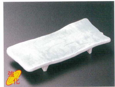
モ105-22-2 御深井 9.0長角皿 (27×15.3×3.8cm) ¥2,900 2224105022