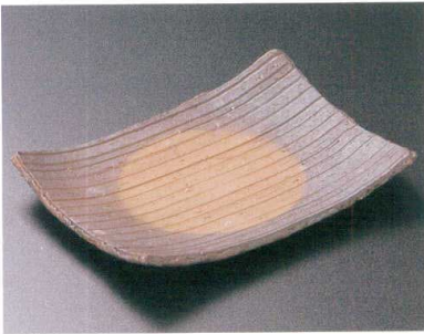
テ105-21-2 手造り伊賀焼締 長角7.0皿 (21×16×3cm) ¥3,100 2111096012