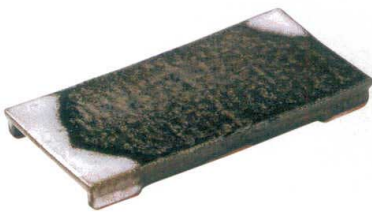
ワ105-31-2 かこのまな板皿 (26×13×3cm) ¥2,800 2209105031