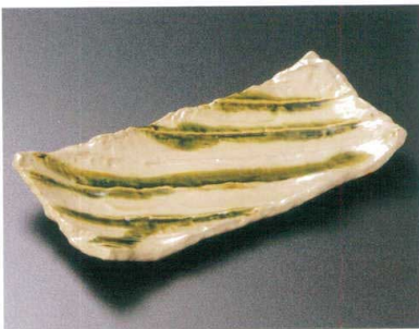
ツ105-41-2 織部流し 削り焼物皿 (26.5×14.5×4cm) ¥2,700 2221105041