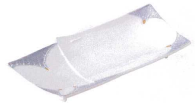
ケ105-33-2 ブルー吹ラスター 重ね皿 (30.5×15×4.5cm) ¥2,800 2130096041