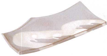
キ105-11-2 粉引流 焼物皿(手造り) (25×12×3cm) ¥3,400 1213103033