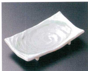
ソ109-11-2 雪もよう 長角焼物皿 (18.7×11cm) ¥1,800 1204104011