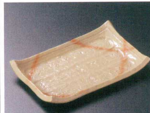
ソ109-44-2 火だすき ガタ彫焼物皿 (21.5×14cm) ¥1,650 1204103042