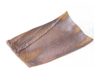
ヤ109-41-2 奔流美膳 焼物皿 (22.5×14.5×3cm) ¥1,700 2110100014