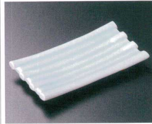
ツ109-33-2 青地イカダ 焼物皿 (25×13.5×3cm) ¥1,700 1221103012