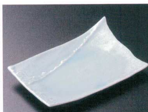
ヤ109-42-2 清流しぶき 焼物皿 (22.5×14.5×3cm) ¥1,700 2110100013