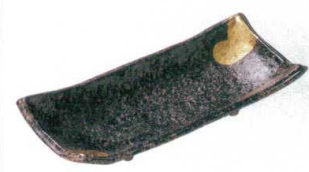
モ109-23-2 南蛮金彩 焼物皿 (23.5×11×4.5cm) ¥1,750 1424106041