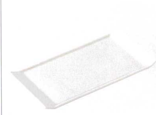
ツ109-43-2 日だまり 23cmプラター (23×11.7×1.4cm) ¥1,700 2121100023