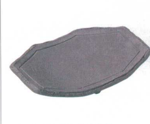
ウ109-54-2 黒八角 焼物皿 (21×15.5×4.5cm) ¥1,600 2101101011