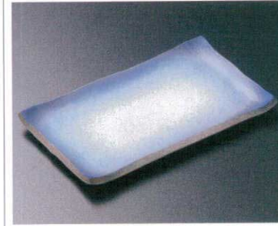
モ109-53-2 青雲 8.0焼物皿 (23.7×14×1.6cm) ¥1,600 1424111033