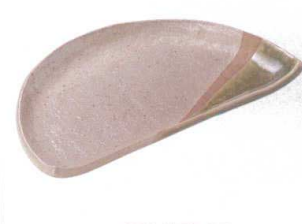
モ109-34-2 緑彩 半月8.0皿 (25×15×2cm) ¥1,700 1227105027 モ109-35-2 緑彩 半月7.0皿 (21×12.6×2cm) ¥1,250 1227105026