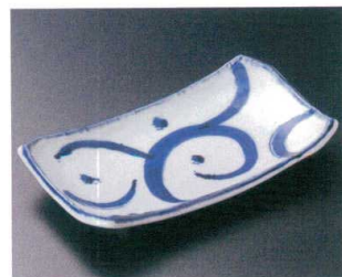
ウ109-31-2 銀彩唐草 足付焼物皿 (25×14×4.3cm) ¥1,700 2101100052