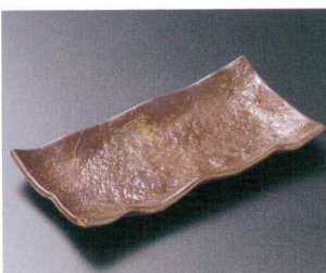
ソ109-22-2 石目焼メ芦 焼物皿 (24×12.2×2.5cm) ¥1,760 2104100044