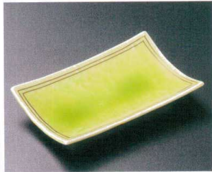
リ109-13-2 ヒワ金線 焼物皿 (18×11.3×3cm) ¥1,600 1429108041