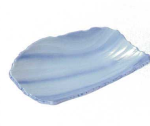
リ109-52-2 青磁流水彫 7寸皿 (21.5×16.5×3.8cm) ¥1,650 2029107042