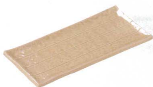
ケ109-12-2 手造り灰釉 長角皿 (26.5×13cm) ¥1,800 1430107033