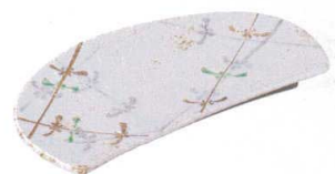
ツ109-14-2 秋草 半月附出皿 (23.7×11.8×2.5cm) ¥1,750 1201117014