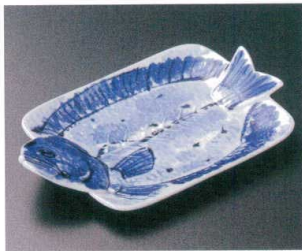
モ109-24-2 呉須 魚型焼物皿 (22×14.5×3.6cm) ¥1,750 2224109024