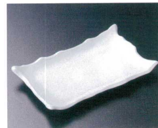
ミ109-51-2 舞 長角皿 (27×16×3cm) ¥1,650 2023107041 (中国製)