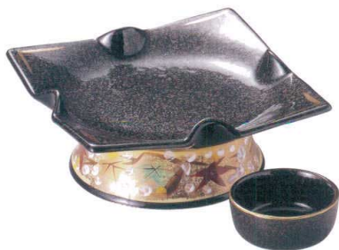
ソ11-13-2 黒釉高台春秋 刺身鉢 (16×16×6.3cm) ¥3,200 1204012045 ソ11-14-2 黒釉高台春秋 丸千代口 (φ6.5×3cm) ¥700 1204012046