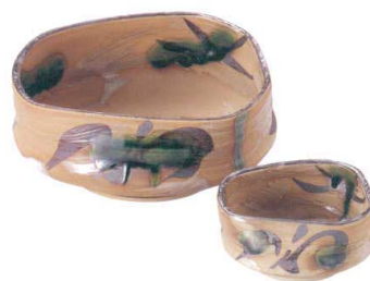
ツ11-15-2 黄瀬戸風オリベ流 向付 (13.5×13.5×5.8cm) ¥2,700 1421011053 ツ11-16-2 黄瀬戸風オリベ流 千代口 (7.8×7.8×4cm) ¥880 1421011054