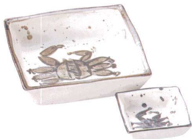
ヒ11-31-2 かに手描 角5.0鉢 (15.5×15.5×4cm) ¥2,650 2217011031 ヒ11-32-2 かに手描 角千代口 (7.5×7.5×2.5cm) ¥1,270 2217011032