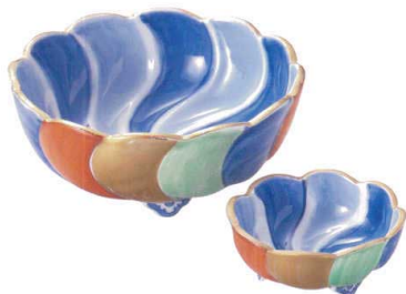
ソ11-11-2 花ごころ 刺身鉢 (φ14.5×6cm) ¥2,860 1204013041 ソ11-12-2 花ごころ 千代口 (φ5.3×3.5cm) ¥1,150 1204013042