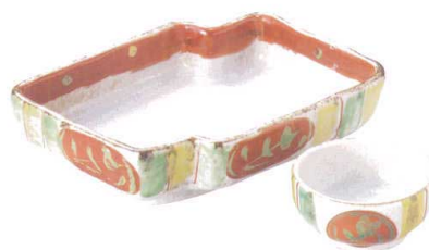
ソ11-35-2 十草赤丸紋 刺身鉢(大) (16.5×12.5cm) ¥2,980 1204010017 ソ11-36-2 十草赤丸紋 千代口 (φ7.2×3.5cm) ¥1,100 1204010018