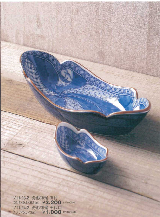
ツ11-23-2 舟形祥瑞 向付 (23.8×9.6×5.5cm) ¥3,200 1221009041 ツ11-24-2 舟形祥瑞 千代口 (10.5×5.3×3cm) ¥1,000 1221009042