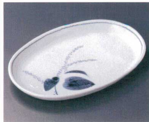
ス111-22-2 布目草花 小判8.0皿 (23×16.3×1.8cm) ¥1,280 2026113046