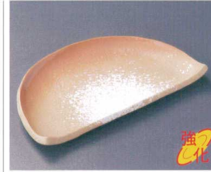
モ111-14-2 雪どけ 7.0半月皿 (21.3×12.3×2.2cm) ¥1,300 2024140021