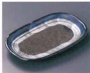
チ111-42-2 測紺巻 8.0小判皿 (24×15.5×2.8cm) ¥1,200 1808113032