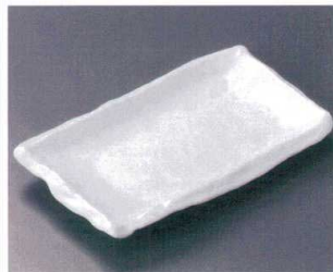
ミ111-32-2 匠白 長角皿 (22.5×14×3cm) ¥1,260 2023109022