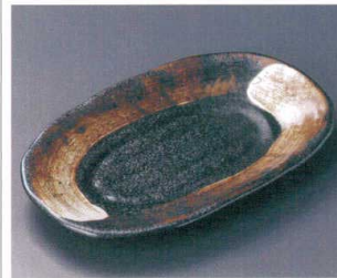
ソ111-23-2 黒結晶白刷毛 六兵衛型多用皿 (24.2×16×2.5cm) ¥1,260 2104102033