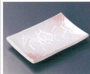
ト111-53-2 桜志野 焼物皿 (21×14×2.5cm) ¥1,100 1816114021