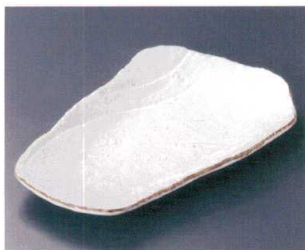
ケ111-41-2 測サビ巻粉引 荒瀬焼物皿 (27×17×3cm) ¥1,250 2130102034