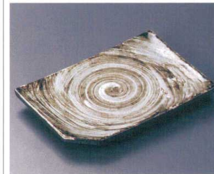
ト111-34-2 うず潮 焼物皿 (21×14.5×2.5cm) ¥1,250 1416109042