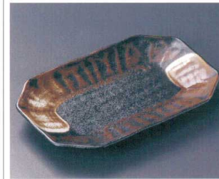
ソ111-24-2 黒結晶白刷毛 八角多用皿 (24×15.5×2.8cm) ¥1,260 2104102032