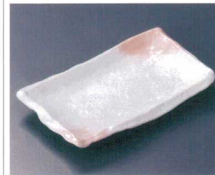
テ111-44-2 あげぼの匠 焼物皿 (22.8×14×2.5cm) ¥1,150 2211111044