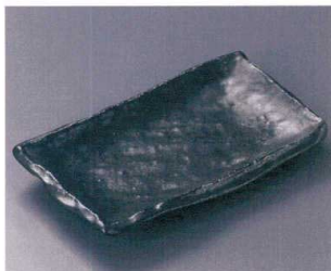
ミ111-31-2 匠黒 長角皿 (22.5×14×3cm) ¥1,260 2023109023