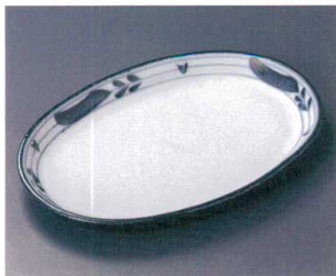
ス111-21-2 若葉 楕円8.0皿 (23.2×16×2cm) ¥1,280 1225107043