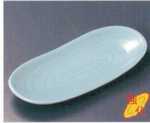
ツ111-12-2 青磁 小判型8.5あゆ皿 (25.5×12×2cm) ¥1,300 1221105043