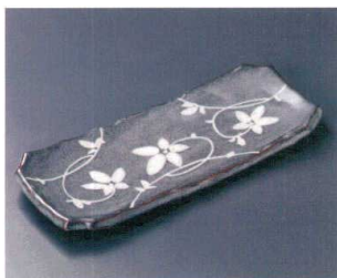
チ111-51-2 ネズ志野唐草 焼物皿 (26×10.5×2cm) ¥1,150 2108102041