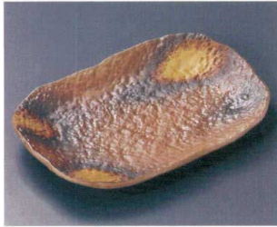
ヤ111-11-2 美膳岩 焼物皿 (21.5×14.5×2.5cm) ¥1,320 1810112051