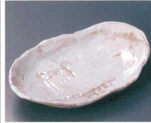
セ111-13-2 手造り風志野 楕円多用皿 (24.8×16.4×4cm) ¥1,280 2132102014