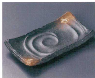
ミ111-52-2 黒備前 足付焼物皿 小 (22×14×3cm) ¥1,150 2123102042