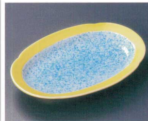
セ111-43-2 黄彩ブルー 小判7.0皿 (21.2×14.9×3.1cm) ¥1,200 1832133022