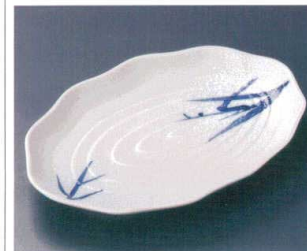
ト111-54-2 石焼木目 笹 10吋小判皿 (26.5×18×3.5cm) ¥1,120 2216111054 ト111-55-2 石焼木目 笹 9吋小判皿 (24×17×2.7cm) ¥920 2216111055 ト111-56-2 石焼木目 笹 8 1/2吋小判皿 (21.5×15.3×2.5cm) ¥840 2216111056