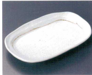
ヤ113-22-2 粉引ライン スバ皿 (24.5×16×3cm) ¥900 1810428055