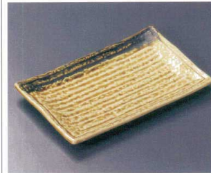
モ113-43-2 黄瀬戸織部 8.0焼物皿 (23×15×2cm) ¥800 2024109041