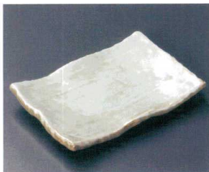
モ113-31-2 白雲 6.0四ツ足皿 (17.1×12.2×2.9cm) ¥850 2024109032