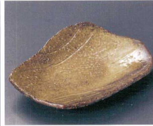
ウ113-13-2 不動荒瀬型 前菜皿 (22×16×3.7cm) ¥920 2101104014