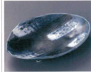
リ113-34-2 呉須刷毛目 小判皿 (22×15.3×4cm) ¥830 2129104041