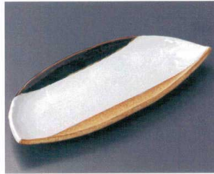
モ113-12-2 アメ塗分 焼物皿 (27.8×12.7×2.5cm) ¥940 2124103034