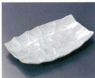
ウ113-51-2 青地刷毛 手折焼物皿 (23.5×15×3cm) ¥800 2101104033