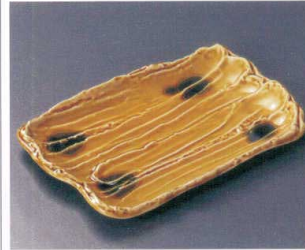
ツ113-23-2 黄瀬戸 荒そぎ焼物皿 (22×15×2cm) ¥900 2121104013