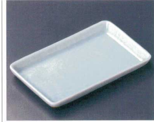
セ113-14-2 青磁 7.0長角皿 (20×12.6×2cm) ¥900 1832114015