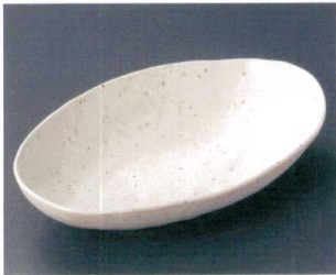
ヤ113-11-2 結晶マット 楕円鉢 (24.5×16.3×5cm) ¥1,000 2110128032