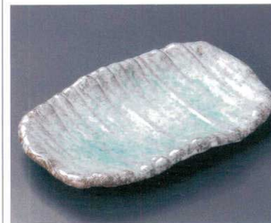
ヨ113-53-2 青釉 6号波形長角皿 (21×13.5×3cm) ¥800 2228113053