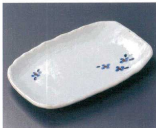
ス113-41-2 粉引小花 小判8.0皿 (22.8×15×2.5cm) ¥820 2026110014