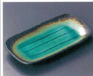
ル113-52-2 ヒスイ 小判焼物皿 (24×13.5×2.4cm) ¥780 1602109032