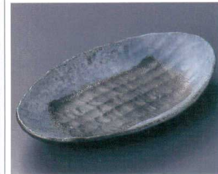
ケ113-54-2 黒志野 四ツ足楕円皿 (23.5×14×4cm) ¥780 2030029011