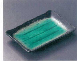
ヤ113-24-2 深海グリーン 焼物皿 (21×14.3×3cm) ¥870 2110104022