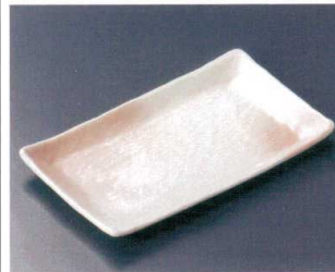
エ113-42-2 桜吹き 焼物皿 (24×14.5×2.5cm) ¥810 1815114031