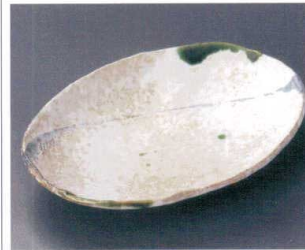
ヨ113-33-2 織部流線 8号小判皿 (24×17×4cm) ¥830 2228113033