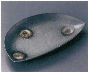
キ113-21-2 南蛮 半月多用皿 (25×16×2.8cm) ¥900 1813114032