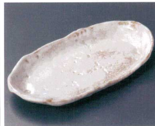
セ113-32-2 手造り風志野 船型皿(大) (23.8×12.8×2.7cm) ¥860 2132103051