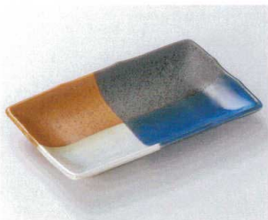
ト114-51-2 モザイク 7.0焼物皿 (21×13×3cm) ¥760 2016110021 ト114-52-2 モザイク 6.0焼物皿 (18.5×13×2.8cm) ¥670 2016110022