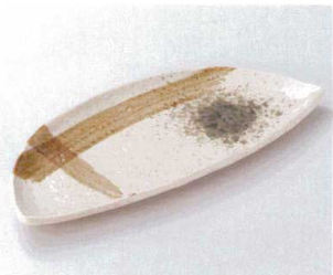
キ114-32-2 錆刷毛 半月皿 (28×13cm) ¥680 2013110033