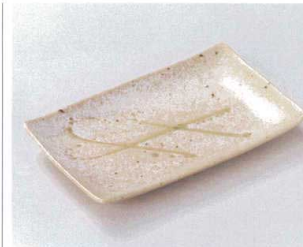
エ114-14-2 筆流し砂丘 焼物皿 (18.8×12×2cm) ¥700 2115105043