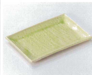
ス114-56-2 ひわ 長角皿 (20×13.5×1.5cm) ¥620 1426109055