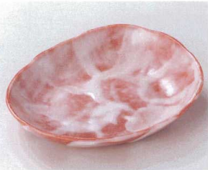
ト114-12-2 赤彩花 夕円小皿 (18.5×15.5×3cm) ¥750 2216114012