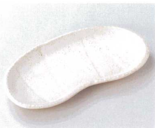
ウ114-22-2 白釉そら豆 焼物皿 (22.7×12.5×2cm) ¥700 2101105031