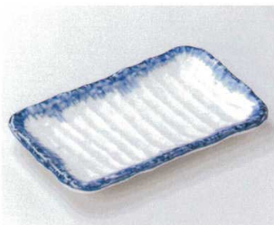
ソ114-21-2 呉須刷毛 角焼物皿 (21.5×13.5cm) ¥700 1604108052