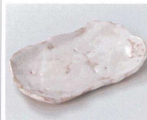
セ114-24-2 手作り風志野 変型焼物皿 (18.3×11.6×2.2cm) ¥690 2132105014