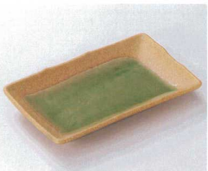
ト114-53-2 石焼フリット 7.0焼物皿 (21×12.8cm) ¥750 1216104041 ト114-54-2 石焼フリット 6.0焼物皿 (18.5×12.5×2.5cm) ¥640 1616109042