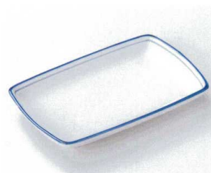
セ114-43-2 呉須筋 焼物皿 (19.5×12.3×2.5cm) ¥660 1832115011