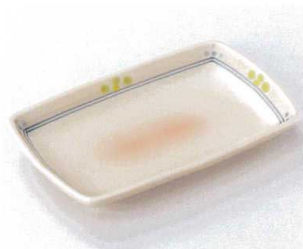
モ114-31-2 萩風早春 6.0長角皿 (19×12×2.5cm) ¥680 2124105024