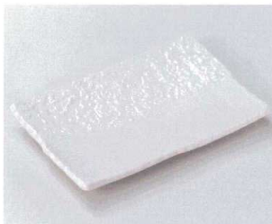
キ114-33-2 白楽 焼物皿 (20.7×14×2.6cm) ¥660 2213114033