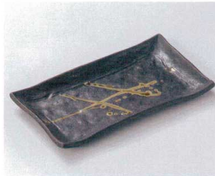
ウ114-13-2 筆流し黒 焼物皿 (22×12×2cm) ¥730 2201114013