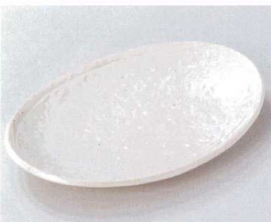
ウ114-41-2 粉引 夕円取皿 (21×15×1.8cm) ¥680 2101105033