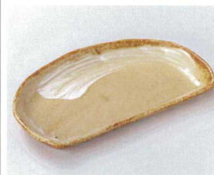
モ114-44-2 黄灰釉 半月焼物皿 (21.5×12.7×2.5cm) ¥640 2124105041