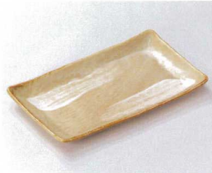
モ114-11-2 黄灰釉 8.0焼物皿 (23.6×14.2×2.3cm) ¥770 2124104045