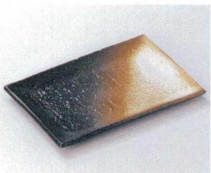
セ114-42-2 夜明け 新焼物皿(浜ナシ) (20×13.7×1.5cm) ¥650 1832115022