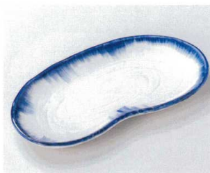
ソ114-23-2 呉須刷毛 まゆ形焼物皿 (21.5×11.2cm) ¥700 1604133051