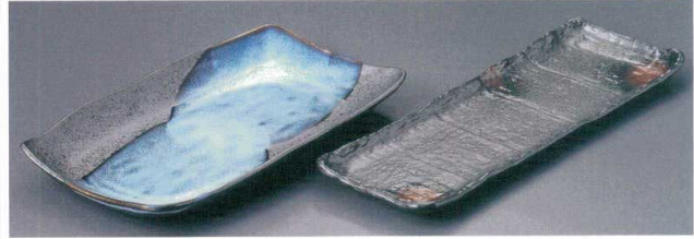
ト129-23-2 清流 ホッケ皿 (30×17.3×3cm) ¥1,850 2116122012