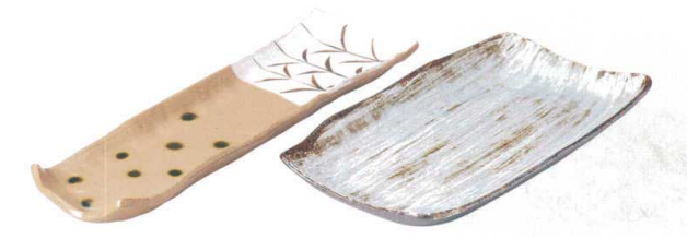
ス129-21-2 化粧織部 長角皿 (39×10.5×2cm) ¥1,900 2026120022