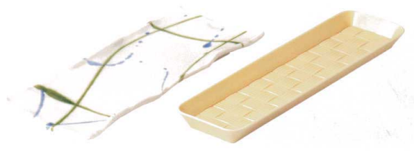
セ129-13-2 乱舞 長角皿 (29.8×12×2.6cm) ¥1,910 2232129013