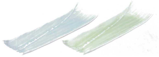
ヤ129-33-2 清流しぶき 長皿 (33.5×9.3×2cm) ¥1,700 2110122021