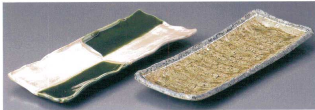
モ129-31-2 オリベ市松 サンマ皿 (30×12×2.5cm) ¥1,600 2124122022