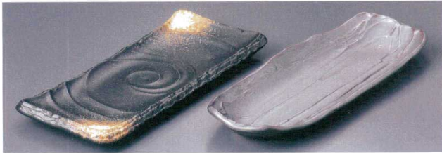
ミ129-11-2 黒備前 足付焼物皿 大 (33×14×2.8cm) ¥2,000 2123121052