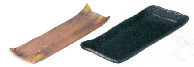
ヤ129-41-2 奔流美膳 長皿 (33.5×9.3×2cm) ¥1,700 2110122013