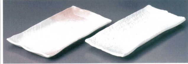
エ129-43-2 桜吹 ホッケ皿 (31×16.5×2.5cm) ¥1,500 1815130051