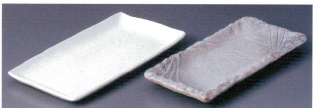
モ130-54-2 ソバ志野 ホッケ皿 (33×17×2.2cm) ¥1,100 2024128052