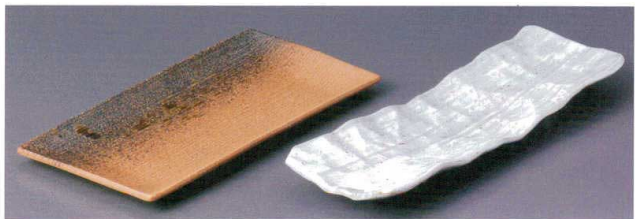
モ130-31-2 伊賀灰釉吹くし目9.0長角皿 (28.3×13.8×2.4cm) ¥1,300 2124123031