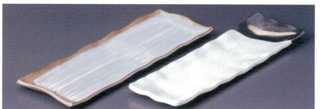
キ130-43-2 灰粉引 サンマ皿 (34.2×12×1.3cm) ¥1,100 1613107052