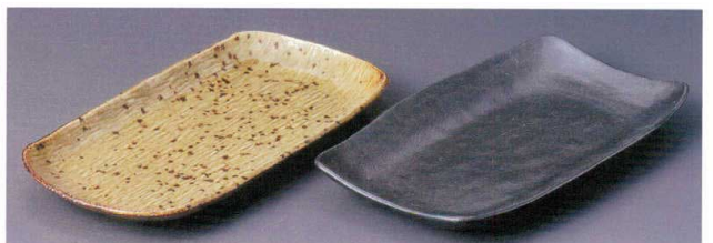
モ130-33-2 黄唐津 小判ホッケ皿 (32.5×17×2.8cm) ¥1,200 2024128051