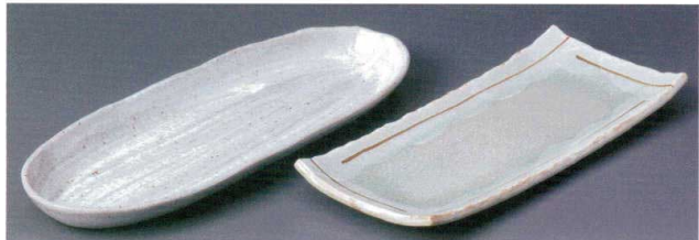
ウ130-21-2 青地刷毛 さんま皿 (34×13×2.5cm) ¥1,350 2201130021