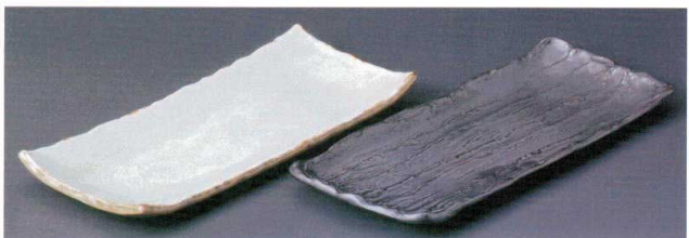
モ130-41-2 白雲 鮎皿 (29×12.7×2.5cm) ¥1,200 2024126053