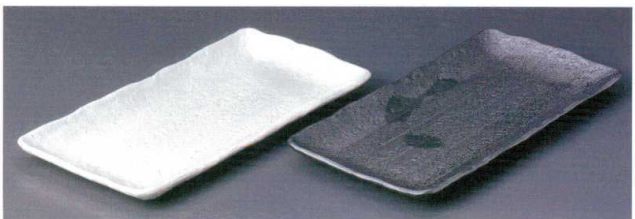
ウ130-51-2 粉引 ホッケ皿 (33×16.5×2.5cm) ¥1,150 1801130053