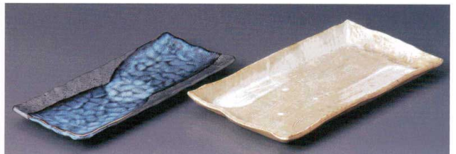
ト130-23-2 清流 サンマ皿 (29×12.5×2.3cm) ¥1,350 2116122053