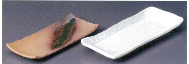
モ130-13-2 星雲伊賀 サンマ皿 (29×12.5×2.8cm) ¥1,350 2124122051