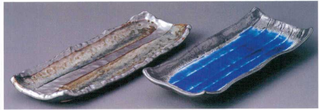
ホ131-33-2 清流 サンマ皿 (31×12×3.5cm) ¥900 2000127023