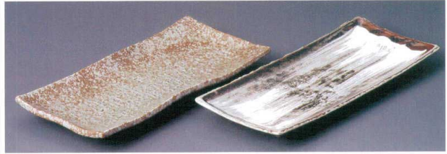
モ131-23-2 益子結晶 サンマ皿 (28×12.8×2.8cm) ¥970 2024127041