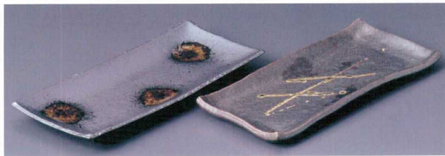
キ131-31-2 南蛮 サンマ皿 (28.5×12.5×2.5cm) ¥950 1813131022