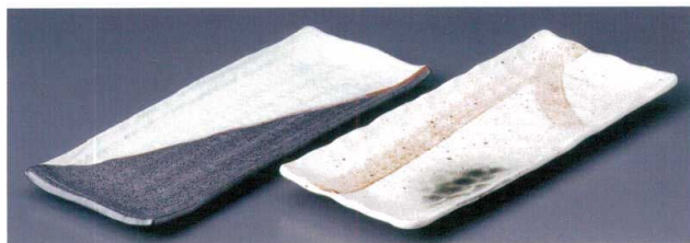
セ131-51-2 塗分 サンマ皿 (31×11.6×2cm) ¥770 2132124033