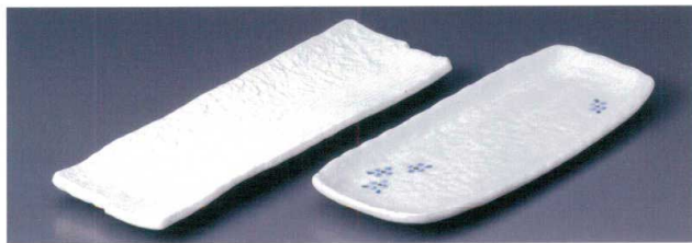
キ131-41-2 白染 長皿 (32.5×10.8×2.5cm) ¥900 2213131041