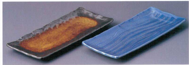
キ131-53-2 灰釉 サンマ皿 (29×12×2cm) ¥700 1813131044