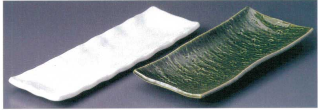
ツ131-13-2 クリーム釉 サンマ皿 (33.5×10×2cm) ¥1,000 1821131024