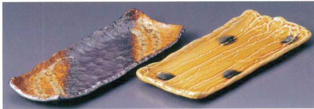
ホ131-21-2 南蛮一珍 サンマ皿 (31×12×3.5cm) ¥1,000 2000127022