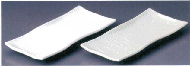
ス131-11-2 白窯変 さんま皿 (28×12.8×3cm) ¥1,000 2026127031