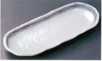
セ134-43-2 御深井ライン 小判型盛皿 (30×13.2×2.5cm) ¥1,390 1832130034