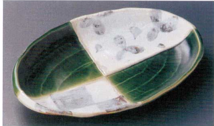
モ134-12-2 織部市松 小判盛皿 (25.5×18.8×3.5cm) ¥2,900 2224134012