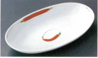
ス134-41-2 赤絵とうがらし 小判8.5皿 (24.8×14.3×3.5cm) ¥1,950 1426275027 ス134-42-2 赤絵とうがらし 小判6.5皿 (19.5×13.8×2.8cm) ¥1,500 1426275023