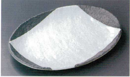
セ134-31-2 あかり 9.0小判皿 (27.2×20.3×2.5cm) ¥2,200 1832428025