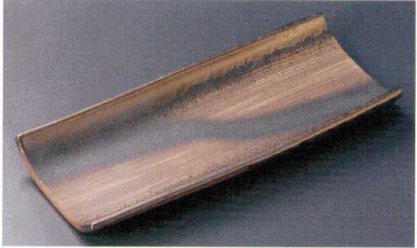
ホ134-32-2 備前金彩 手造り長皿(小) (21.3×11.8×2cm) ¥2,200 2100194023