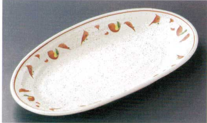
ト134-21-2 鳴門うず赤絵 ダ円長皿(中) (31×17.2×4.2cm) ¥1,080 2216134021