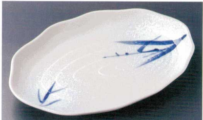
ト134-23-2 石焼木目 笹 12吋小判皿 (31.5×22.3×3.8cm) ¥2,250 2216134023