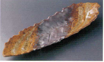
ホ134-53-2 南蛮一珍 葉形ロング皿40cm (40.8×12×4.5cm) ¥1,800 2000126016 ホ134-54-2 南蛮一珍 葉形ロング皿35cm (36×11.3×3.2cm) ¥1,400 2000126017