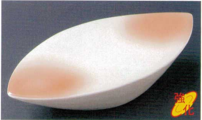
セ134-33-2 あげぼの 多用皿 (23.5×12×3.8cm) ¥1,810 2232134033