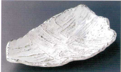
ソ134-22-2 粉引拭取り 変形9.0皿 (27×16.5×5cm) ¥2,250 2104127013