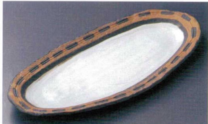
ケ134-13-2 古代塚 楕円長皿 (31.8×14.8×2.8cm) ¥2,850 1630118051