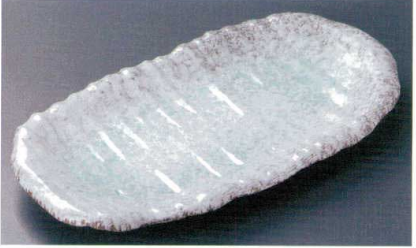
ヨ134-44-2 青釉 10号波形長角皿(細) (31×17×3.5cm) ¥1,300 2228134044