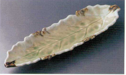
ホ134-55-2 砂ビードロ 葉形ロング皿40cm (40.8×12×4.5cm) ¥1,800 2000126013 ホ134-56-2 砂ビードロ 葉形ロング皿35cm (36×11.3×3.2cm) ¥1,400 2000126014