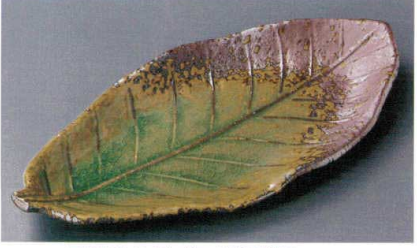
ヨ134-51-2 ビードロ 10号朴葉皿 (32.2×16.4×3.3cm) ¥2,200 2128127031 ヨ134-52-2 ビードロ 9号朴葉皿 (28×14×2.8cm) ¥1,350 2128127032