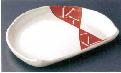
ワ137-12-2 粉引三角紋 半月7.5皿 (23×19×3cm) ¥2,120 1809138034