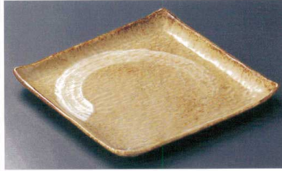
モ137-22-2 黄灰釉 正角大皿 (23.6×23.6×2.6cm) ¥1,900 2124129053