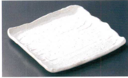
ヤ137-31-2 白釉荒ソギ 角皿 (22×22×2cm) ¥1,700 2110130011