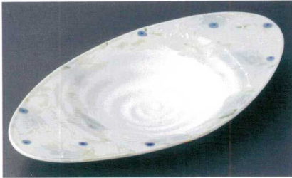
ケ137-11-2 色彩一珍 夕丹皿 (31.5×17.5×4cm) ¥2,200 2130127022