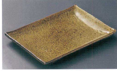
モ137-41-2 黄唐津 長角盛皿 (26.7×20×2.7cm) ¥1,450 2024155021