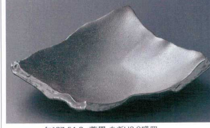
ケ137-54-2 荒黒 ちぎり8.0盛皿 (24×17.5×5.5cm) ¥1,780 2030138051 ケ137-55-2 荒黒 ちぎり9.5盛皿 (17.5×14.6×4cm) ¥1,250 2030140036 ケ137-56-2 荒黒 ちぎり4.0盛皿 (13.5×12.8×3cm) ¥1,000 2030164065