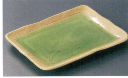
ト137-51-2 フリット 多用皿 (23×17.5×2.5cm) ¥1,000 2016141041