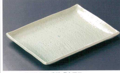
ス137-42-2 青地 長角天皿 (26.5×20×2.5cm) ¥1,650 2026155023