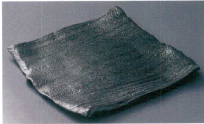
ヨ137-21-2 黒燻し 8号正角皿 (24×24×3.2cm) ¥1,950 2128129043