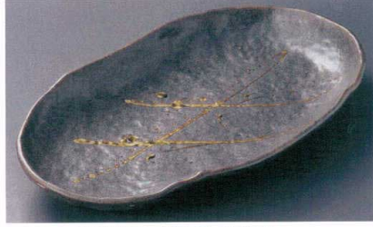
ウ137-13-2 筆流し黒 夕丹盛皿 (31×18.5×4.5cm) ¥1,750 2201137013