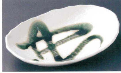
ソ137-23-2 白マット織部流し 大皿 (27×20.5×4cm) ¥1,750 1604172042