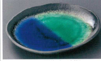
モ137-52-2 彩釉塗り分 7.0小判皿 (22.5×20.5×3cm) ¥1,750 2124130024 モ137-53-2 彩釉塗り分 小判フルーツ (17×15.5×3cm) ¥1,150 2124130025