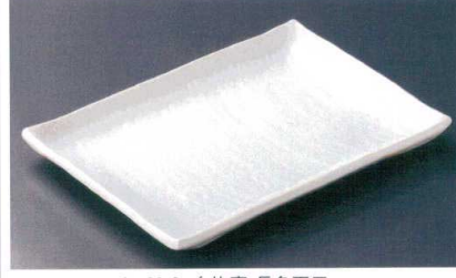
ス137-33-2 白均窯 長角天皿 (26.5×20×2.5cm) ¥1,550 2128130051