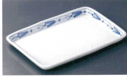
ス137-32-2 花つなぎ 長角9.0皿 (24.5×17×2cm) ¥1,700 2226137032