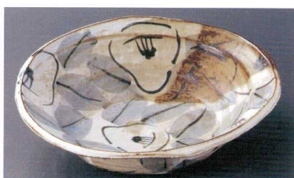
ウ138-33-2 粉引山茶花 8.0鉢 (24.5×23×7cm) ¥3,350 2101131031