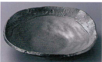
キ138-42-2 黒粒 石目大盛皿 (φ28×6cm) ¥3,300 2113131032