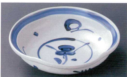
キ138-32-2 花 変形7.0鉢 (φ20.5×6cm) ¥3,400 2113131022