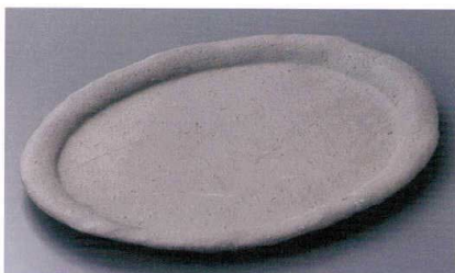
フ138-22-2 黒土炭化 8.5楕円皿 (26.5×21.5×2cm) ¥3,800 2109132013