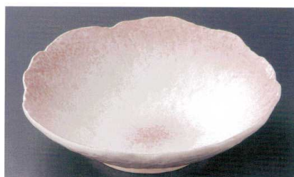
モ138-23-2 ひらめき 花形大鉢 (φ24.5×6.5cm) ¥3,600 1824178043