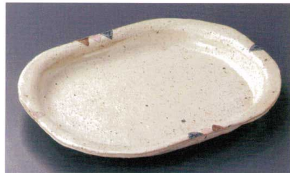
マ138-11-2 手造り粉引 楕円皿 (25.3×20.5×3cm) ¥7,500 1807134021