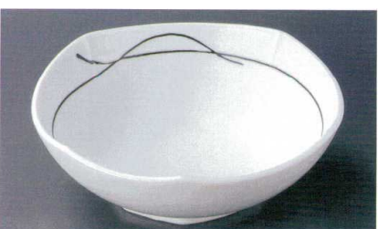
チ138-52-2 絆 大井 (φ22×7.3cm) ¥2,800 2108131041