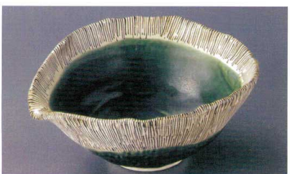
フ138-51-2 織部十草 片口井 (19.8×17.5×8.6cm) ¥3,400 2109169043