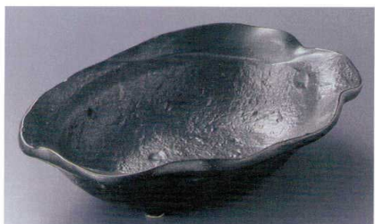
キ138-31-2 黒粒 石目大鉢 (29.5×22.5×9cm) ¥3,800 2113131023