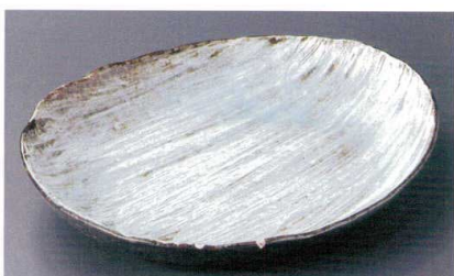
チ138-43-2 白刷毛 ダルマ 大皿 (31×25×5cm) ¥2,900 2108132022