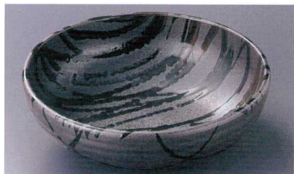
ケ138-21-2 黒繊維部流 8.0ボール (24.5×8.5cm) ¥4,050 1830383041