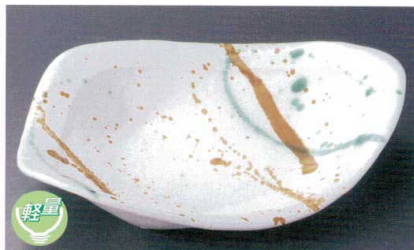
フ138-12-2 「軽量」夢幻 変型尺皿 (29×24.2×6cm) ¥6,000 2109176013