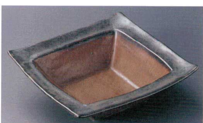
モ138-53-2 鮭 盛鉢 (21×21×7cm) ¥2,450 2124131042