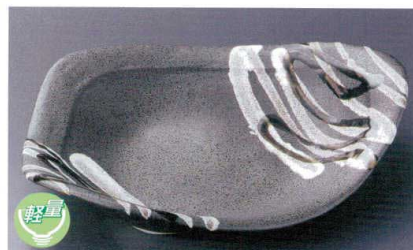
フ138-13-2 「軽量」黒釉乱線 変型10.0皿 (29×24.2×6cm) ¥6,000 2109181011