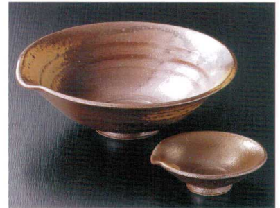
W14-35-2 華備前 片口向付 (φ16.5×5.5cm) ¥2,550 1209010047 W14-36-2 華備前 千代口 (φ7.6×2.8cm) ¥680 1209010048