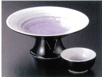
L14-11-2 銀河 透かし高台刺身 (φ15.7×6.6cm) ¥2,600 2205014011 L14-12-2 銀河 丸千代口 (φ6.5×3cm) ¥930 2205014012