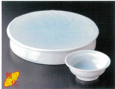
S14-25-2 青磁花画 刺身鉢 (18.5×14×5.3cm) ¥2,600 2232014025 S14-26-2 青磁花画 千代久 (9.8×7.5×3.4cm) ¥1,090 2232014026