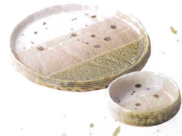
W14-33-2 粉引織部 5.5平皿 (φ17×1.5cm) ¥2,580 2109004043 W14-34-2 粉引織部 千代口 (φ8×3cm) ¥1,030 2109004044