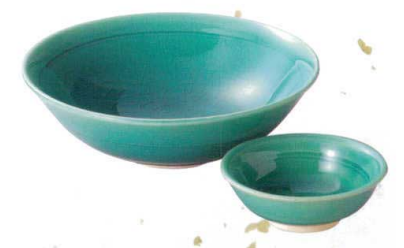
L14-45-2 緑釉 丸向付 (φ15.5×4.8cm) ¥2,450 1829009043 L14-46-2 緑釉 丸千代口 (φ8.5×1.9cm) ¥770 1829009044