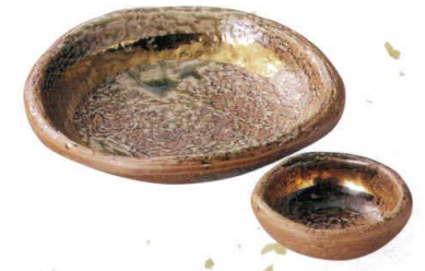
S14-41-2 手造り灰釉 刺身鉢 (φ15.5×3.5cm) ¥2,500 1204012051 S14-42-2 手造り灰釉 千代口 (φ7.5×2.5cm) ¥1,150 1204012052