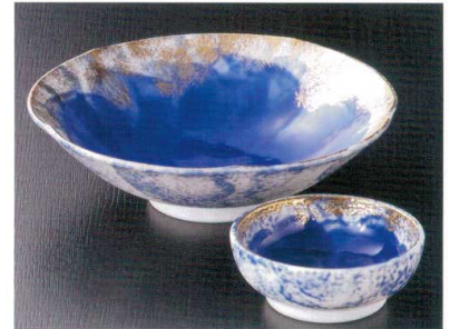
S14-15-2 銀れい 向付 (φ16×5.2cm) ¥2,600 1204006043 S14-16-2 銀れい 千代口 (φ8×3cm) ¥1,000 1204006044