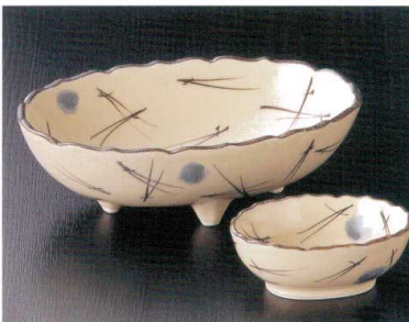
T14-23-2 小判松葉散 京向付 (17.5×11.5×5.5cm) ¥2,600 1621004031 T14-24-2 小判松葉散 千代口 (8.8×6.5×3.5cm) ¥900 1621004032