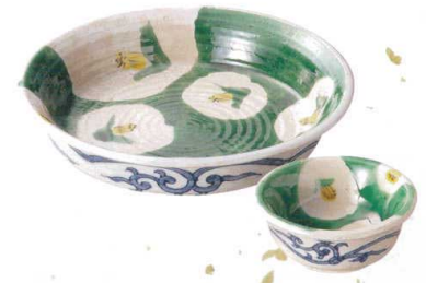
S14-21-2 グリーン交趾絵 向付 (φ15.3×3.5cm) ¥2,600 1404013023 S14-22-2 グリーン交趾絵 千代口 (φ7×3cm) ¥1,310 1404013024