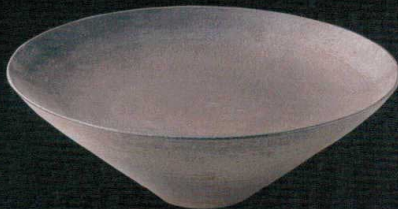
ワ140-21-2 炭化 スタンドプレート平(L) (φ26×9.3cm) ¥5,650 2230140021