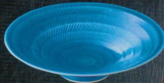
ケ140-22-2 トルコ青飛びカンナ 8.0鉢 (23.3×5.6cm) ¥5,550 1830177021