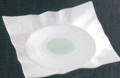
ソ140-42-2 一珍ラスターヒワ吹 9.0折紙皿 (27.5×26.5×4.2cm) ¥3,950 2004189011