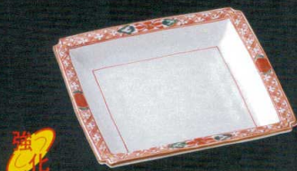
ワ140-41-2 赤玉文 八寸角皿 (19×19×2.8cm) ¥4,200 1409128031