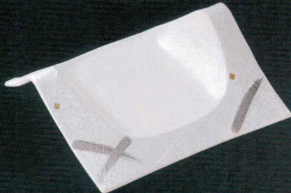
ケ140-31-2 プラチナラスター 三角立体皿 (31×20×3cm) ¥4,500 2230140031