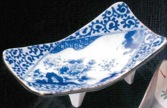
リ140-12-2 染付岩牡丹 まな板高台皿 (27.5×15.5×8cm) ¥4,200 2229140012