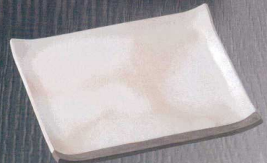
ワ140-23-2 黒白 26cmスクエア(L) (25.8×23×3cm) ¥4,550 2109133033