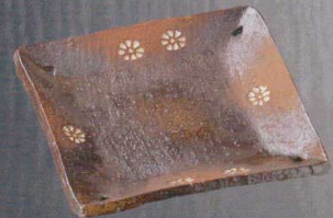
エ140-33-2 透し印花 正角皿 (約20×20×3cm) ¥4,300 1215121031