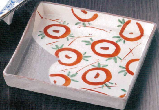
ヒ140-13-2 手書赤絵粉引 8.0角皿 (23×23×3.6cm) ¥4,800 2017133012