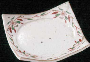
ツ140-11-2 錦花園粉引 正角皿 (20.5×20.5×5.5cm) ¥9,500 1221120022