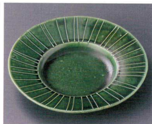
ツ142-13-2 織部 一珍八寸皿 (φ24.5×3.3cm) ¥3,300 2221142013