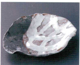
キ142-44-2 新雪 変形皿 (21×18×3.8cm) ¥3,100 2113136053