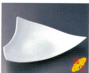
リ142-34-2 青白磁山型 11.0鉢 (33×14×5.1cm) ¥3,100 2129136012