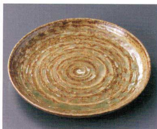
マ142-22-2 伊良保 7.0皿 (φ22.3×2.7cm) ¥3,300 1207129013