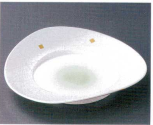
チ142-53-2 ラスター—ヒワ吹 両上り8.0皿 (23.8×23×4.7cm) ¥3,000 2008134051