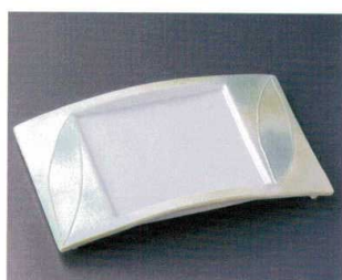
ル142-24-2 ラスター萌黄銀彩 弓型 前菜皿 (26×16.7×3.2cm) ¥3,200 2205142024