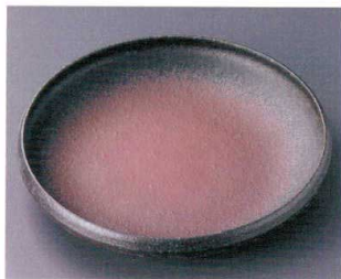
リ142-21-2 BIZEN 8寸鉢 (φ25×4.5cm) ¥3,300 2029143021