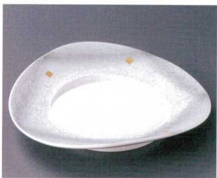
ソ142-32-2 ラスター—珍グレー 8.0皿 (φ23.2×4.8cm) ¥3,150 2022134052