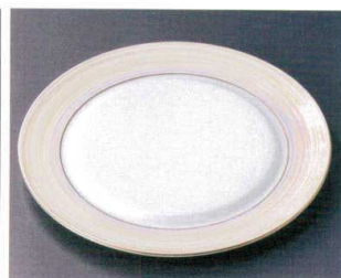
リ142-14-2 測金ラスター 25cmハイプレート (φ25.5×1.8cm) ¥3,300 2129136032