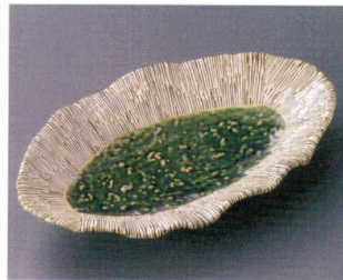
ワ142-12-2 織部十草 花型楕円皿 (26.7×16×4cm) ¥3,300 2209142012