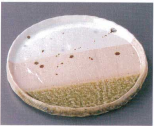
ワ142-42-2 粉引織部 6.5平皿 (φ19.8×1.8cm) ¥3,100 2109135023