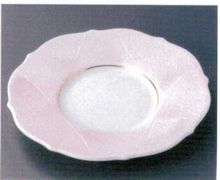
ワ142-54-2 二色ラスター リム皿 (φ21×2.8cm) ¥3,000 2209142054