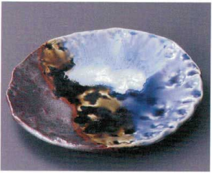
キ142-41-2 ブルーのふ 変形皿 (21×18×2.5cm) ¥3,100 2113137012