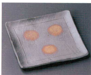
エ142-23-2 磁輪鉄丸紋 前菜皿 (約18.5×18.5×2cm) ¥3,200 1215124013