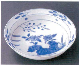
ワ142-31-2 岩牡丹 兜鉢(大) (φ20.9×4.8cm) ¥3,200 2209142031