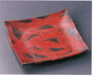
リ142-51-2 根来峠 正角盛込皿 (23.5×22.5×3cm) ¥3,100 2129134036