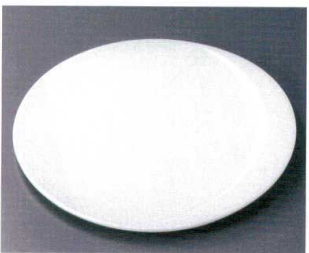
テ142-43-2 うすあさぎ 新月前菜皿 (φ27.3×1.5cm) ¥3,100 2111135031