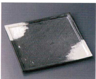
テ142-33-2 黒陶粉引 8寸スクエアプレート (23.2×23×1.5cm) ¥3,100 2111135024