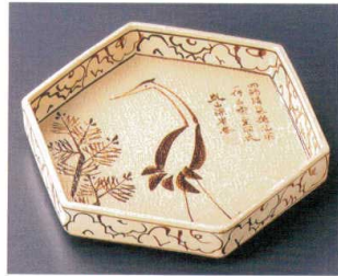
リ142-11-2 乾山鶴絵 六角皿 (17.5×20×3.4cm) ¥3,420 2129135033