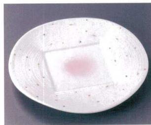
ル143-31-2 ピンク吹ラスター 8.0皿 (φ24.6×2.7cm) ¥2,900 2105135053