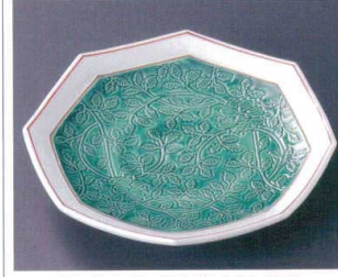
ワ143-24-2 緑交趾 6.0八角皿 (φ18×3cm) ¥2,700 1209126033