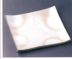
ワ143-14-2 御本手 角皿(大) (21×21×1.8cm) ¥2,900 1809136042