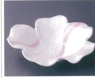
ソ143-34-2 ピンクラスター流し 花形鉢 (φ22.8×5.4cm) ¥2,900 2121136034