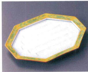
テ143-21-2 黄交趾 八角皿 (24.5×18.5×2cm) ¥2,900 2211143021