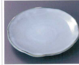
セ143-54-2 よもぎ 7.0天皿 (φ22.3×3.5cm) ¥2,220 1832151032

刺身鉢 干代口 向付 中鉢 小鉢 小付 珍味入 桜花堂 蓋向付 煮物障 小皿 蒸し碗 土瓶蓋し 燗物皿 仕切り皿 突出皿 鉢皿 多用皿鉢 前菜皿 天皿 吞水 和皿 銘々皿 小皿 盛皿・鉢 大皿・鉢 組鉢 焼酎 カップ ゴブレット 酒器 卓上小物 調理用品