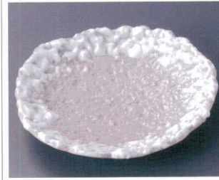
ヤ143-33-2 雪盛奔流 7.0皿 (22×21.5×4cm) ¥2,800 2110136042