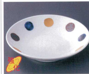
ウ143-52-2 金彩丸紋 6.8皿 (φ20×4.2cm) ¥2,850 1601129011