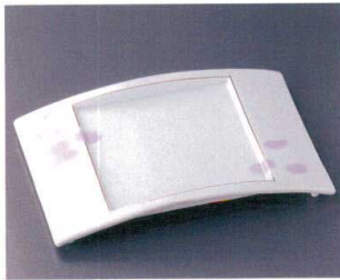
ル143-11-2 ラスター弓型 前菜皿 (25.5×16.6×3.2cm) ¥3,000 2005134041