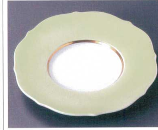
ソ143-44-2 ヒワ リム7.0皿 (φ21.5×2.3cm) ¥2,700 1621127041