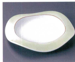
ソ143-51-2 ヒワ ウエーブ皿 (19.8×2.3cm) ¥2,700 2021135054