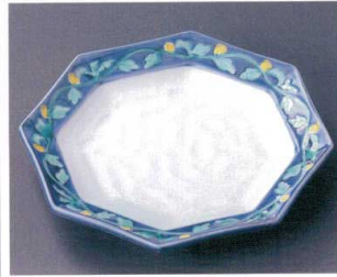
ソ143-22-2 交趾唐草 八角皿 (φ17.5cm) ¥2,800 1204128053