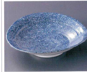
ヒ143-53-2 たご唐皿 ひずみ皿 (20.3×19.3×4.3cm) ¥2,750 2217143053