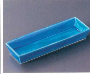
リ143-23-2 トルコ釉 切立前菜皿 (21.7×7×3.3cm) ¥2,900 2229143023