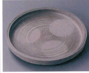
ケ143-13-2 炭化土 切立7.5皿 (φ22.7×3cm) ¥2,950 1830150033