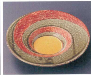
ル143-32-2 錆うず 6.5皿 (φ23.5×4cm) ¥2,900 2205143032