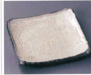
ル143-43-2 緑釉カイラギ 正角皿 (18×18.5×3cm) ¥2,700 1605127021