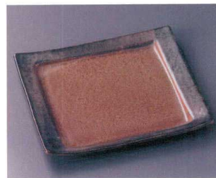
モ143-41-2 鮎 角大皿 (24.5×23.2×3cm) ¥2,900 2124136033