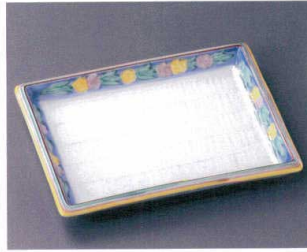
テ143-12-2 小花交趾 長角皿 (20.5×16.5×2.2cm) ¥2,950 1211126055