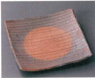
テ145-11-2 手造り伊賀焼締 正角6.0皿 (18×18×3cm) ¥2,500 2111137024