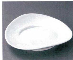
ミ145-51-2 青白磁 両上り8.0皿 (23.7×4.6cm) ¥2,150 2023137024