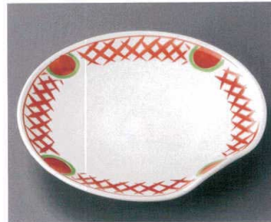
キ145-41-2 赤絵 7.0皿 (φ21×3cm) ¥2,200 1213211027