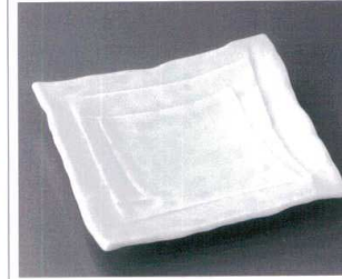
ミ145-53-2 青白磁 角6.5皿 (20.3×20.3×3.4cm) ¥2,150 2023137011