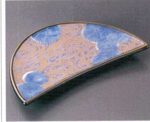
ケ145-23-2 黒釉菊流水 半月皿 (21.8×11.5×2.5cm) ¥2,150 1430133022