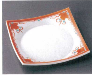
ソ145-12-2 赤絵 四方皿 (17×17×3.4cm) ¥2,350 1221130024