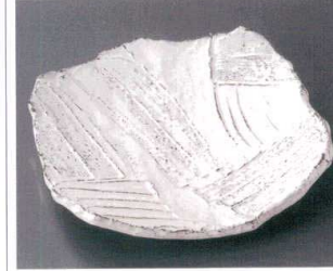
ソ145-43-2 粉引拭取り 変形6.5皿 (19.5×19.5×4.7cm) ¥2,180 2104138022