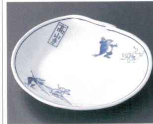
テ145-52-2 高山寺 一方切7.0皿 (21.5×19.5×4cm) ¥2,050 2211145052