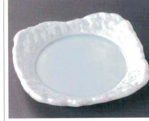
ヤ145-34-2 青白磁石焼 7.0四方皿 (20.5×20.5×4cm) ¥2,150 1410132053