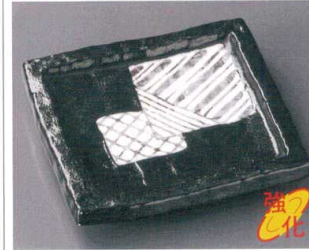
ソ145-42-2 黒織部 砂目5.5皿 (17×17×3.5cm) ¥2,150 2004137043