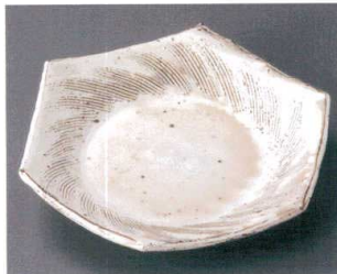
リ145-21-2 粉引クシメ 六角皿 (19.5×17.8×3.4cm) ¥2,300 1629132012