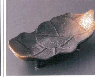
ミ145-54-2 黒備前 双葉盛鉢 (26.5×15×9cm) ¥2,300 2123138011