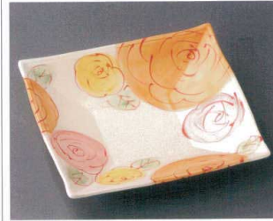
ソ145-32-2 色彩バラ 四角皿 (17.5×17.3×3.2cm) ¥2,250 2104138013