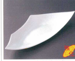
リ145-14-2 青白磁山型 12.0長皿 (37×14×5cm) ¥2,330 2129138023