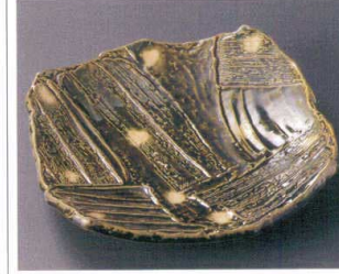
ウ145-24-2 オリベ小紋 6.5皿 (20×20×3cm) ¥2,350 2101138021