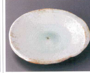
ス145-44-2 伊賀青磁 8.0皿 (φ25×4cm) ¥2,250 1826424022