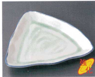
セ145-31-2 御深井 三角盛皿 (22.5×22.5×2.2cm) ¥2,480 2232145031