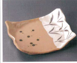
ス145-13-2 化粧織部 丸角菓子鉢 (20×18×6cm) ¥2,350 2026136043