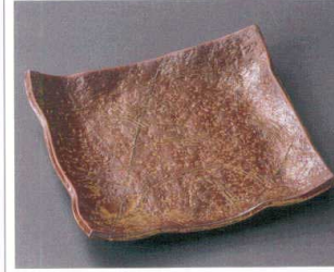
ソ145-33-2 石目焼 芦 前菜皿 (18×18×3.5cm) ¥2,200 2104138054