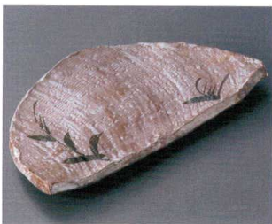
ソ146-22-2 銀彩芦 半月天皿 (25×14cm) ¥2,050 1204131041