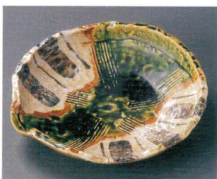
ツ146-33-2 織部櫛目 片口鉢 (φ19.3×4.3cm) ¥2,000 2121139011