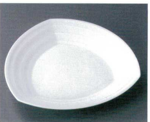
テ146-51-2 うすあさぎ 前菜皿 (21×3cm) ¥1,750 2011138021