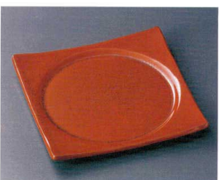
ウ146-53-2 朱赤 四角皿 (20.5×20.5×2.2cm) ¥1,650 2001139022