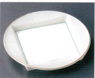
ソ146-42-2 銀彩 角彫皿 (φ18.5×2.5cm) ¥1,870 1204130023