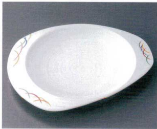
ツ146-12-2 色すずき 前菜皿 (22.3×18×2.5cm) ¥2,100 2121139013