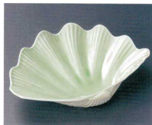
ツ146-14-2 ひわ 貝型盛鉢 (26.5×20×4.5cm) ¥2,000 2121139012