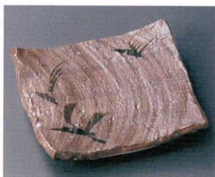
ソ146-23-2 銀彩芦 5.5正角皿 (18×18cm) ¥2,050 1204130022