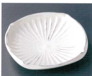
リ146-34-2 粉引菊彫 6.0皿 (18.3×18.3×3.8cm) ¥1,980 2129139051