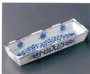
リ146-24-2 染付タコ唐草 7.0切立前菜皿 (21.3×7×3.3cm) ¥2,200 2229146024