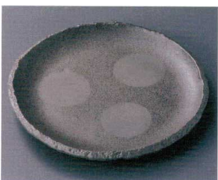
キ146-43-2 炭化土 ちぎり7.5皿 (φ22.5×2.5cm) ¥1,850 2013154033