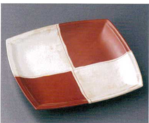
ス146-32-2 朱市松 角大皿 (22×22×2.5cm) ¥2,000 2126403012