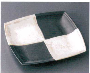
ス146-31-2 黒市松 角大皿 (22×22×2.5cm) ¥2,000 2126403013