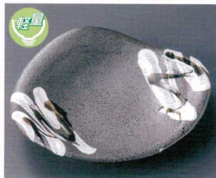
ワ146-13-2 「軽量」黒釉乱線 変型6.5皿 (20×18.3×4.2cm) ¥2,050 2209146013