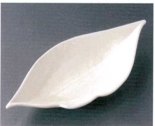
ツ146-41-2 定窯リーフ 尺一皿 (33.5×15.5×5cm) ¥1,900 2021138054