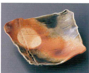
チ146-44-2 嵯峨野 変形前菜皿 (17.5×16×5cm) ¥1,750 2108139034