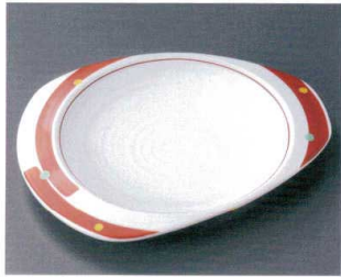
ツ146-11-2 刷毛目水玉 前菜皿 (22.3×18×2.5cm) ¥2,100 2121139014

和食器 平皿 前菜皿 茶碗 湯呑 湯杯 茶碗蓋 湯呑蓋 湯杯蓋 茶托 湯呑托 湯杯托 茶巾 湯呑巾 湯杯巾 茶巾袋 湯呑巾袋 湯杯巾袋 茶巾箱 湯呑巾箱 湯杯巾箱 茶巾籠 湯呑巾籠 湯杯巾籠 茶巾巻 湯呑巾巻 湯杯巾巻 茶巾帯 湯呑巾帯 湯杯巾帯 茶巾箱 湯呑巾箱 湯杯巾箱 茶巾籠 湯呑巾籠 湯杯巾籠 茶巾巻 湯呑巾巻 湯杯巾巻 茶巾帯 湯呑巾帯 湯杯巾帯