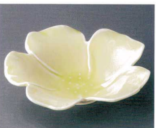
ケ146-52-2 花型 ヒワ釉深皿 (23×5.5cm) ¥1,700 2130139054