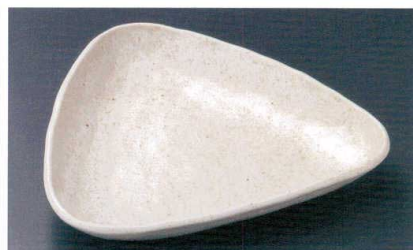
キ154-24-2 粉引風 三角皿(大) (23.5×24×4cm) ¥2,500 2213154024