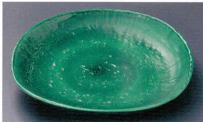
ソ154-12-2 グリーン交趾 8.0皿 (φ22×4cm) ¥3,200 1222133021