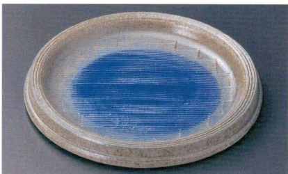
ケ154-42-2 藍葎 切立6.5皿 (φ20×2.2cm) ¥2,150 2130147031