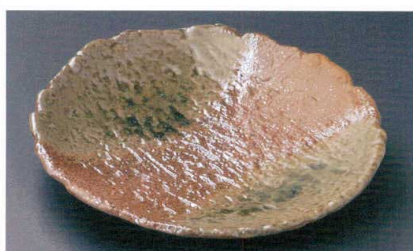
ヤ154-54-2 織部砂目 7.0皿 (21.5×21cm) ¥1,850 1810152032