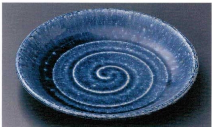
ウ154-41-2 コバルト 7.0皿 (φ21×3.5cm) ¥2,150 2101147033