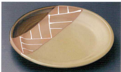
ワ154-31-2 一珍網代貴入 8.0皿 (φ25×2.7cm) ¥2,450 2109137023