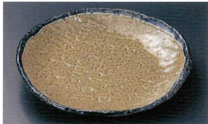
ス154-11-2 藍彩一珍 8.0丸皿 (φ25×4cm) ¥3,250 1826312029