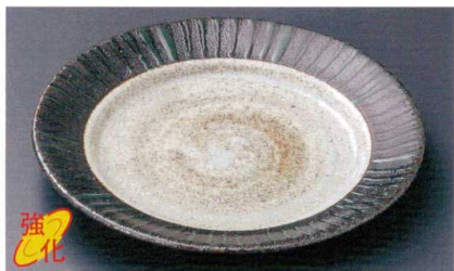
ケ154-21-2 淵グリーン渦 7.5皿 (φ22.5×3.5cm) ¥2,650 1430132023