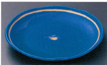
モ154-22-2 青翠蟹画 8.0小判皿 (25×23×4cm) ¥2,750 1224140042