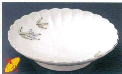
ハ154-33-2 錦若松 天皿 (φ20.5×4.5cm) ¥2,200 2206154033