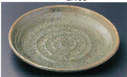
ツ154-32-2 さび織部 8.0皿 (φ25×3.8cm) ¥2,200 2221154032