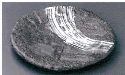
キ154-43-2 炭化白刷毛目 ミツ足7.0皿 (φ21×2.5cm) ¥2,100 2113147032