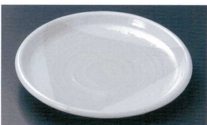
モ154-53-2 白志野 7.0天皿 (φ21.6×3.5cm) ¥2,000 1227137045