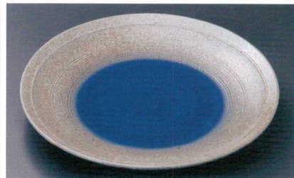
ケ154-13-2 藍華 8.0皿 (φ25×3.5cm) ¥3,150 1430158023