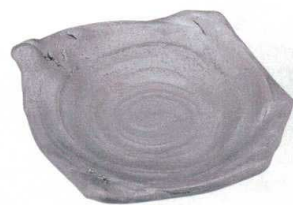
ワ158-52-2 炭化いぶし 手びねり皿(中) (19×18×8cm) ¥2,160 2209158052