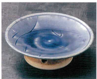
ヤ158-51-2 呉須釉 高台5.0皿 (φ16.5×5cm) ¥2,200 1210031041