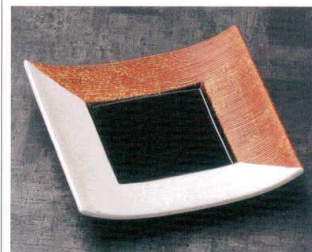
ワ158-33-2 赤半掛 正角皿 (16.7×16.7×3.8cm) ¥2,500 2209158033