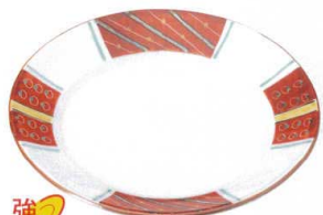
ワ158-31-2 浏金流水 5.5皿 (φ16.8×2.5cm) ¥2,500 1809155012