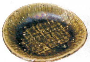
ツ158-43-2 織部タタラ 丸皿 (18×17×2.5cm) ¥2,300 1221144041