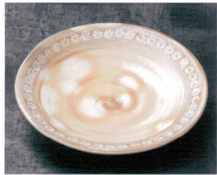
キ158-11-2 粉引三島 6.0皿 (φ18.5×3cm) ¥4,300 1222142021