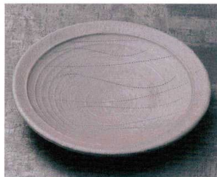
テ158-22-2 黒陶ルレット 6寸皿 (17.5×3cm) ¥2,600 1611144021