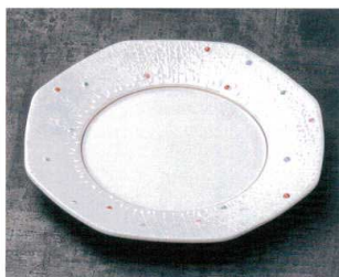
エ158-42-2 水玉ラスター 八角皿(小) (18.6×18.6×2cm) ¥2,300 2015159031