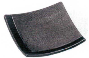
テ158-14-2 黒陶 四方皿 (15.5×15.5×2.8cm) ¥2,700 1411130052