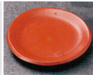
ル158-13-2 朱 5.0皿 (φ17.3×2.5cm) ¥3,600 1205127052