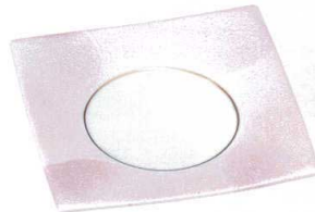
ワ158-23-2 二色ラスター 正角皿 (18×18×2.2cm) ¥2,500 2209158023