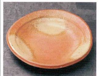
エ158-24-2 伊賀吹ケズリ 手起平皿 (φ17.5×2.8cm) ¥2,500 1415147031