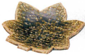
ツ158-12-2 織部 モミジ皿 (18×18.5×3.5cm) ¥3,600 1221143014