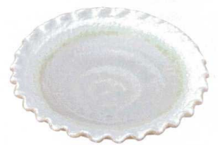
ケ158-34-2 波瀾緑雪 6寸盛皿 (φ20×4cm) ¥2,350 1430132041