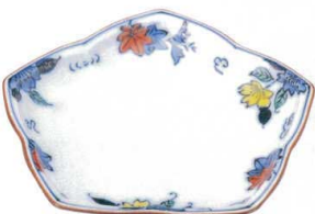
ツ158-41-2 古染春秋万歴 桔梗皿 (18.5×15.3×2cm) ¥2,350 1221144021