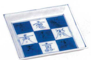
モ158-54-2 慶福角 5.5皿 (16.5×16.5×2.8cm) ¥2,120 1824155033