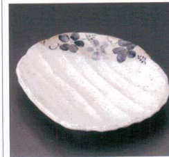
モ161-32-2 藍花 6.0皿 (18.1×15.4×2.8cm) ¥1,100 2224161032