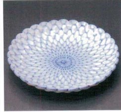
ス161-12-2 あみ 菊型4.5皿 (φ14.2×2cm) ¥1,300 2226161012