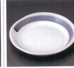
ツ161-34-2 白マット呉須刷毛 5.0皿 (φ15×2.1cm) ¥1,100 2021161053