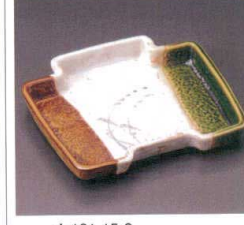
セ161-15-2 三彩苜 変型角皿 (15.2×13.6×2.1cm) 50入 ¥1,250 2032161041