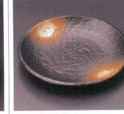
ス161-56-2 吹黒備前 丸7.0皿 (φ20.3×3cm) ¥1,000 2126154021