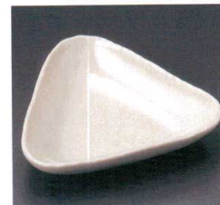
ト161-41-2 粉引 三角皿(中) (17.4×3.5cm) ¥1,100 2116154035