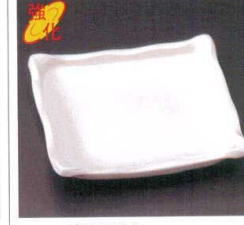
リ161-26-2 NB 四方上り皿 (15×15×2.3cm) ¥1,130 1829158032