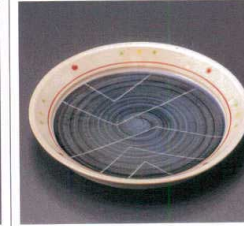
ワ161-43-2 色絵ガスリ 4.8皿 (φ14.5×2.1cm) ¥1,050 1209147024