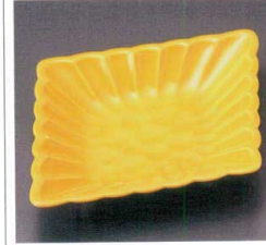
リ161-23-2 黄釉 菱型皿 (21×16.5×3cm) ¥1,200 2029027054