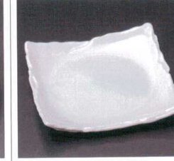
リ161-44-2 青白磁 重ね5.0角皿 (16×16×2.8cm) ¥1,050 2029161051