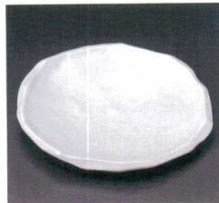
ミ161-21-2 舞 丸6.5皿 (φ20×2cm) ¥1,250 2123153052 (中国製)