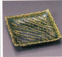
モ161-22-2 織部ソギ角和皿 (17×17×2.5cm) ¥1,200 1424135041