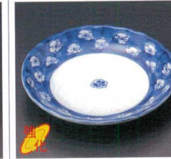
モ161-53-2 梅づくし 5.5丸皿 (16.4×2.7cm) ¥1,020 2024162043 モ161-54-2 梅づくし 4.5丸皿 (13.6×2.2cm) ¥790 2024162044