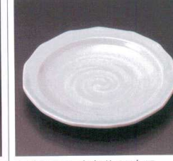
セ161-35-2 青白磁 5.0丸皿 (16.5×2.5cm) ¥1,090 1832161011 セ161-36-2 青白磁 4.5丸皿 (14.1×2cm) ¥900 1832161036