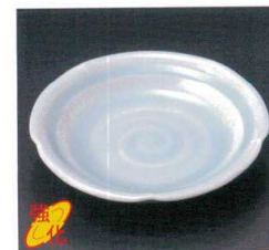
モ161-51-2 青白磁輪花 フルーツ皿 (15.2×3cm) ¥1,050 2024161045