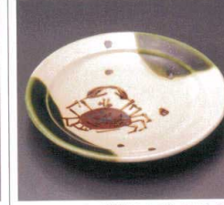
セ161-24-2 織部かに絵 5.0丸皿 (φ15×2cm) ¥1,140 2232161024 セ161-25-2 織部かに絵 3.0丸皿 (φ9.8×1.5cm) ¥640 2232161025