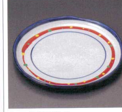
モ161-14-2 新珠スナック 5.0丸皿 (φ16×1cm) ¥1,300 2124154011