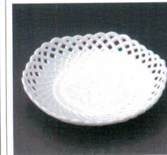
リ161-52-2 白磁スキャン フルーツ皿 (15.5×15×3cm) ¥1,030 1429150024