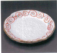
モ161-11-2 志野唐草 6.0皿 (φ18×2.2cm) ¥1,300 2224161011