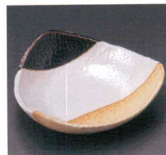
モ161-31-2 アメ塗分 三角取皿 (16.5×16.5×4.2cm) ¥1,100 2124154014