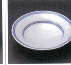
テ161-55-2 呉須帯 リム4.8皿 (φ15×4cm) ¥1,000 2211161055