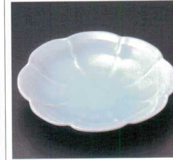
リ161-33-2 青白磁 花型5.0皿 (φ16×3.3cm) ¥1,100 1422150014