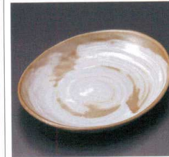
キ161-42-2 灰粉引 多用皿 (21×17×3cm) ¥1,050 1813171046