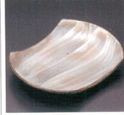
リ161-13-2 粉引ハケメ 分銅型皿 (16.2×12×3cm) ¥1,300 2129153053