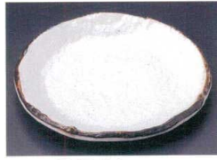
モ163-12-2 ソバ志野 6.0丸皿 (18×2.2cm) ¥750 2024162061