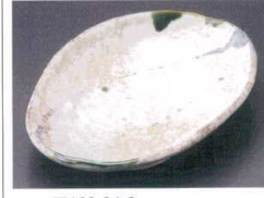
ヨ163-34-2 織部流線 6.5号小判皿 (19.5×14×4cm) ¥630 2228163034