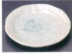
ヤ163-13-2 みちの 荒石目17丸皿 (φ17×2.5cm) ¥750 2110156014