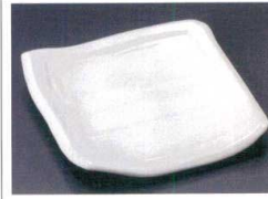
ソ163-43-2 粉引ソギ 銘々皿 (14.5×13.8×2.3cm) ¥540 2004169042