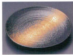
モ163-41-2 黒備前 6.0丸皿 (φ17×2.3cm) ¥630 2224163041