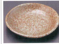
モ163-54-2 益子結晶 5.0丸皿 (φ14.8×2.5cm) ¥480 2024163054