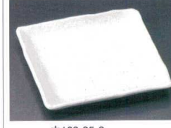
ウ163-35-2 粉引 四角皿 (16.3×16.3×2cm) ¥630 2101156042