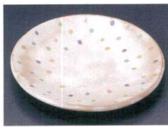
キ163-21-2 花火 5.0皿 (φ15.5×1.7cm) ¥730 2113156025