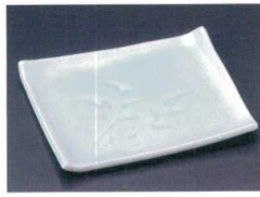
チ163-31-2 青白磁 角銘々皿 (15×12.5×1.2cm) ¥660 1208156044