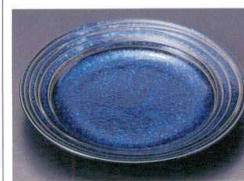
チ163-62-2 雲海 5.0フルーツ皿 (φ16×2cm) ¥280 1208147055