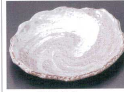
ヨ163-44-2 うず潮 5号皿 (16.8×15×2.8cm) ¥530 2028163044