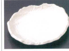
ヨ163-45-2 白地うず潮 5号皿 (17.2×15.2×2.8cm) ¥530 2028163043