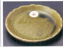
チ163-53-2 鉄織部 4.5皿 (φ14.5×2cm) ¥490 2008167023