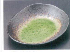
ワ163-25-2 ヒワ吹 楕円多用皿(小) (18.2×15×3.5cm) ¥680 2209163025