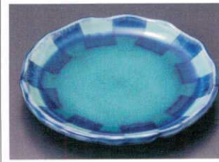
モ163-42-2 市松 5.0丸皿 (15.5×2cm) ¥570 2024163033