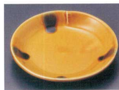
ツ163-51-2 黄瀬戸 4.5丸皿 (φ15×3cm) ¥530 2121156055