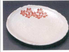
モ163-24-2 おしばな(赤) 取皿 (16.7×15.2×1.8cm) ¥680 1624148052