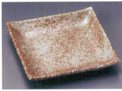
モ163-11-2 益子結晶 正角皿 (17.2×17.2×2.7cm) ¥770 202414051