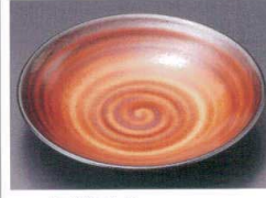
ヒ163-14-2 志野化粧 リップル6.0皿 (φ20×4cm) ¥750 2117156024