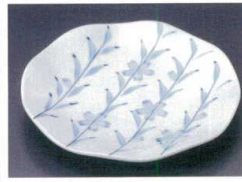
モ163-23-2 花だより 5.5丸皿 (φ17×2.6cm) ¥700 1824159021