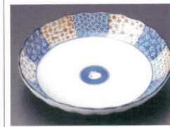
ヤ163-66-2 丸紋うさぎ 5.0皿 (φ16.5×3.6cm) ¥260 2210163066 ヤ163-67-2 丸紋うさぎ 4.0皿 (φ13.6×2.9cm) ¥200 2210163067 ヤ163-68-2 丸紋うさぎ 3.5皿 (φ12.3×2.4cm) ¥160 2210163068