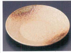
テ163-32-2 伊賀織部 石目5.0丸皿 (φ15.2×2.1cm) ¥660 2211163032