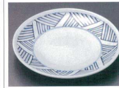
ス163-69-2 矢羽根 5.0丸皿 (φ16.2×2.5cm) ¥830 2226163069 ス163-610-2 矢羽根 40.丸皿 (φ12.7×2cm) ¥600 2226163610 ス163-611-2 矢羽根 3.0丸皿 (φ10.3×2cm) ¥430 2226163611