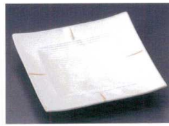
ワ163-22-2 クロス 千段角皿(小) (15×15×3cm) ¥700 2109156013