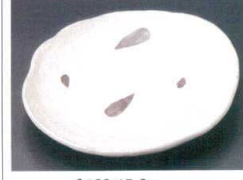
チ163-15-2 木の葉 5.5皿 (18×16.7×3cm) ¥750 1808159016