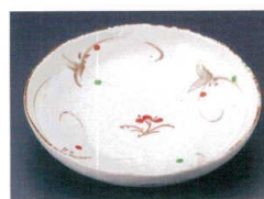
ヤ163-61-2 粉引赤絵唐草 5.0皿 (φ16.5×3.7cm) ¥450 2210163061