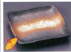
ワ163-52-2 黒備前 正角皿 (13.5×13.5×2.5cm) ¥500 2209163052