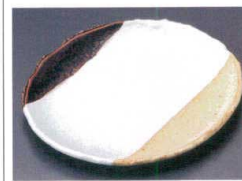
モ163-63-2 アメ塗分 取皿 (16.5×15×1.6cm) ¥760 2124156016 モ163-64-2 アメ塗分 銘々皿 (13.5×12.5×1.6cm) ¥680 2124156017 モ163-65-2 アメ塗分 小皿 (11×10×1.6cm) ¥550 2124156018