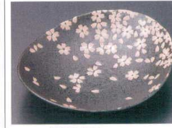
ミ163-55-2 平成桜 黒だ円皿 (14.8×4.2cm) ¥450 2123156064