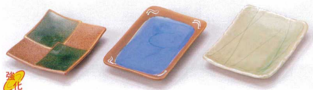
セ168-31-2 南蛮市松 のり皿 (12.7×10.2×2.1cm) ¥750 1832164015 ケ168-32-2 南蛮交趾 のり皿 (16.3×10×2.1cm) ¥710 1830164016 ス168-33-2 ビード口線 5.5皿 (16×11×2cm) ¥700 1226105021