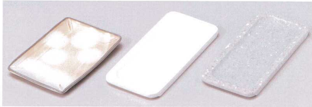
ワ168-11-2 御本手 長角皿 (17.5×11.8×1.3cm) ¥1,880 1809160016 チ168-12-2 人工大理石 盛込皿(白) (21.5×9.7×1.3cm) ¥1,200 2108161013 チ168-13-2 人工大理石 盛込皿(マール) (21.5×9.7×1.3cm) ¥1,200 2108161014