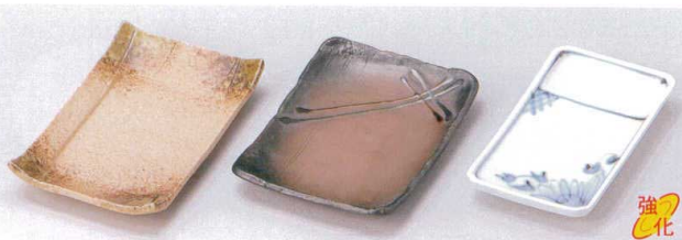
テ168-14-2 伊賀織部 5.5長角四方皿 (16.8×10.3×2.8cm) ¥1,050 2211168014 モ168-15-2 流星 長角5.5皿 (16×11×2.3cm) ¥850 1624115012 セ168-16-2 花かご 多用小皿 (15.2×8.2×2cm) ¥810 1832121024