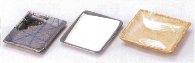
モ168-41-2 南蛮乱十草 長角銘々皿 (14.5×10.5×1.8cm) ¥640 1424153021 セ168-42-2 あかり 長角銘々皿 (14.5×11.3×1.3cm) ¥640 1832164032 モ168-43-2 黄灰釉 角取皿 (13.6×14.2×2.5cm) ¥640 2124161043