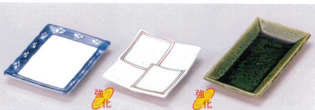
モ168-24-2 梅づくし 長角のり皿 (13.8×10.5×1.7cm) ¥750 2024168013 セ168-25-2 市松志野ライン のり皿 (12.7×10.3×2.2cm) ¥750 2032168016 テ168-26-2 織部 長角6.0皿 (17×9×2cm) ¥740 2111161023