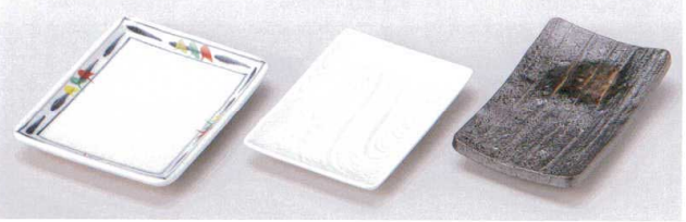
ス168-51-2 結び三色点字 銘々皿 (15.2×11.8×2cm) ¥600 1226151023 エ168-52-2 青白磁清流 銘々皿 (15×10×1.8cm) ¥600 1215150043 チ168-53-2 白吹 のり皿 (15.5×9.3×3cm) ¥590 1408153032