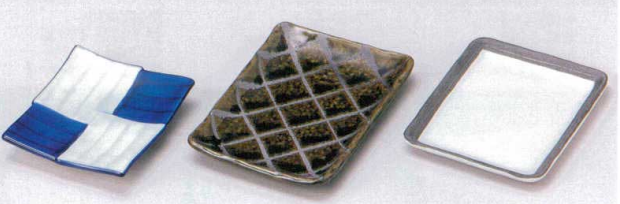
セ168-44-2 市松刷毛目のり皿 (12.5×10×1.8cm) ¥640 1832164031 モ168-45-2 灰釉カゴメ 6.0長角皿 (17×11.5×1.8cm) ¥620 1824115013 モ168-46-2 桃山 銘々皿 (14.5×11.2×1.3cm) ¥610 2024168032