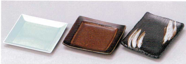
ツ168-21-2 あさぎ千段 14cm正角皿 (13.5×13.5×1.5cm) ¥800 2121161031 モ168-22-2 鉛角取皿 (14×13.5×2cm) ¥810 2124161021 ウ168-23-2 さみだれ 取皿 (16.5×12×2cm) ¥770 2201168023