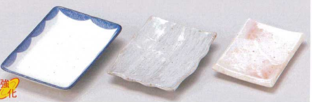
セ168-54-2 波重ね 6.0長角皿 (17×11.5×3cm) ¥590 2132161055 ウ168-55-2 青地刷毛 手折皿 (15×12×2cm) ¥500 2201168055 ト168-56-2 桜志野 のり皿 (13×9×1.8cm) ¥580 2016169034