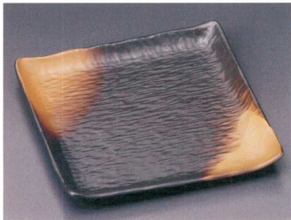
ス175-31-2 美濃黒備前 正角皿 (23.8×23.8×2.8cm) ¥2,200 2126168021