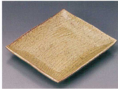
モ175-22-2 黄唐津 角盛皿 (30×26.2×3.5cm) ¥2,500 2124168012