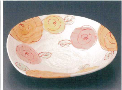
ソ175-13-2 色彩バラ 8.0盛鉢 (φ25×5.4cm) ¥3,100 2104167043