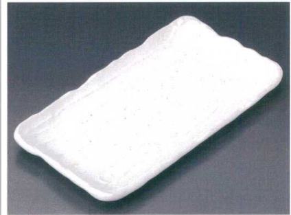
ヤ175-33-2 白釉荒ソギ ほっけ皿 (33×18×2cm) ¥2,000 2110168022