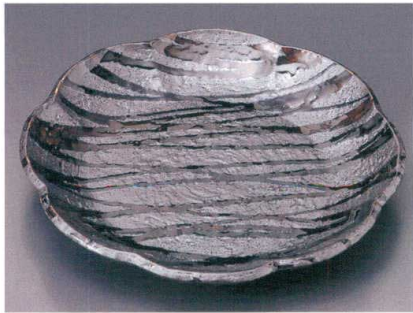
ケ175-21-2 黒織部流 8.5皿 (φ26.8×4.3cm) ¥2,650 1830422041