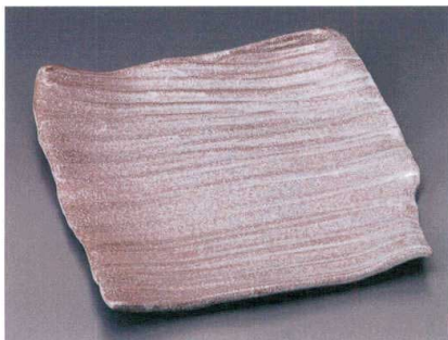
ヨ175-41-2 雪志野 8号正角皿 (24×24×3.2cm) ¥1,950 2028143041