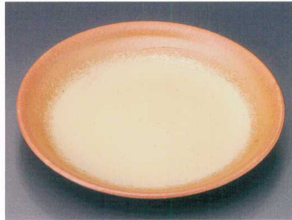
ケ175-12-2 伊賀吹き玉淵 8.5皿 (φ26×3.8cm) ¥3,150 1830142031