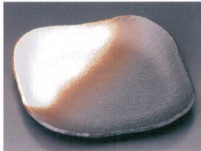
セ175-32-2 夜明け 盛皿 (24.8×24.8×3.1cm) ¥2,150 1832189042