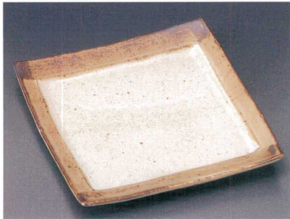
キ175-11-2 きなり 回角大皿 (24.5×24.5×2.5cm) ¥3,000 2113287012