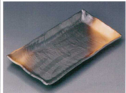
ス175-43-2 美濃黒備前 櫛目長角皿 (31.5×16.5×2.5cm) ¥1,600 2126168042