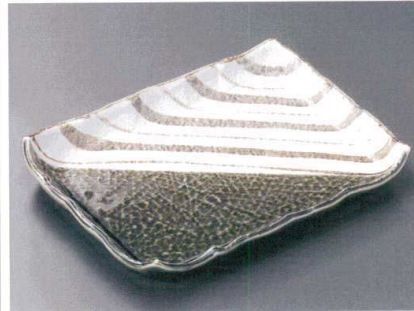
モ191-22-2 織部ストライプ 長角大皿 (37×27.5×4.5cm) ¥6,850 2224191022