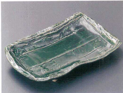
ソ191-11-2 織部 尺二寸盛込皿 (35×22.5×5cm) ¥8,200 1204160021