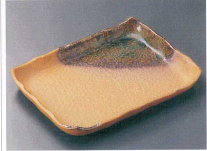
モ191-23-2 伊賀 長角大皿 (36×27×4.5cm) ¥6,200 2024187022