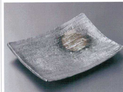
チ191-44-2 白吹 尺二角皿 (35×27.5×6.5cm) ¥5,700 1408161011