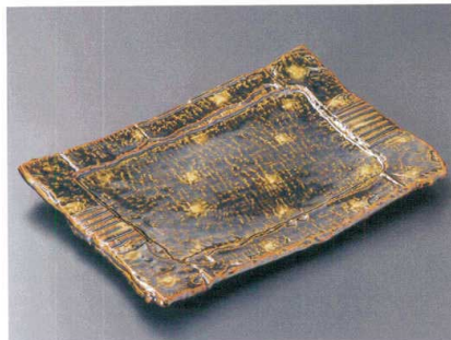
リ191-21-2 織部黄瀬戸小紋 13.0盛皿 (39×28×3.5cm) ¥6,800 2029187023