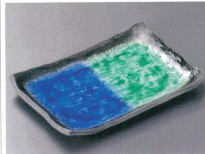
モ191-32-2 彩釉塗り分 12.0盛皿 (37×26.5×4cm) ¥6,800 2124185033