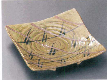
ソ191-12-2 灰釉格子 盛込皿 (31.5×31.5×6.5cm) ¥7,100 1204160041