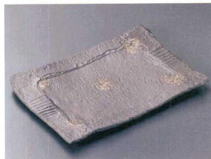
ソ191-31-2 炭化土 砂目長角13.0盛皿 (38×27.4×4cm) ¥6,200 2004188011