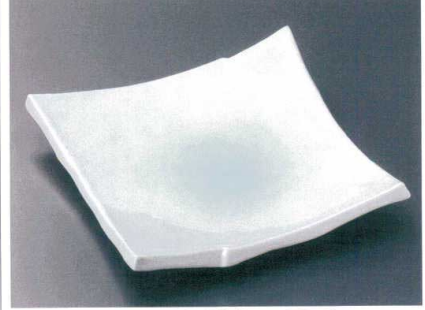
リ191-13-2 青白磁井桁 10.0正角盛皿 (30.5×30.5×6.5cm) ¥7,000 2029187043