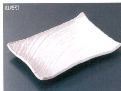
ヒ191-41-2 角皿(大) (37×24.5×4cm) ¥6,000 2217191041 ヒ191-42-2 角皿(中) (31×21×4cm) ¥4,600 2217191042 ヒ191-43-2 角皿(小) (26×17.5×3.5cm) ¥2,800 2217191043