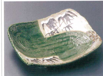
ソ191-45-2 織部竹 四ツ足盛皿 (30×26.5×6.5cm) ¥5,700 1204160011