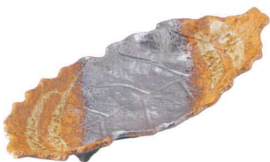
ホ201-51-2 南蛮一珍 葉形大皿 (41×17.5×5.5cm) ¥2,000 2100192041