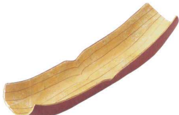
リ201-21-2 金彩ストライプ 11.0長角鉢 (37.3×9×7.1cm) ¥3,350 2029118032