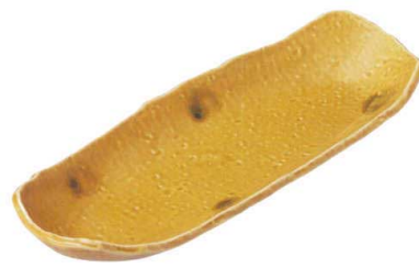
ソ201-32-2 黄瀬戸 尺一盛皿 (37×14.5×4.5cm) ¥1,850 2121194043