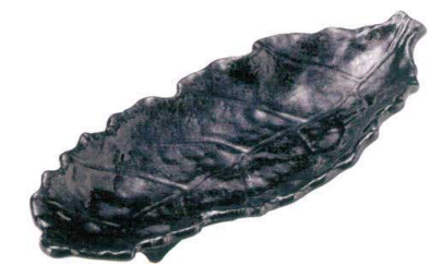
ホ201-54-2 油滴天目 葉形大皿 (41×17.5×5.5cm) ¥2,400 2200201054 ホ201-55-2 油滴天目 葉形中皿 (26×11×3.5cm) ¥700 2200201055