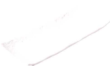
リ201-22-2 ねーじゅ 石目11.0長角深皿 (34.5×13.5×3.7cm) ¥2,650 2129194041