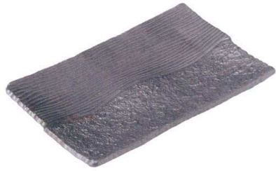
キ201-33-2 黒楽 長角大皿 (32.5×21×3.4cm) ¥2,400 2213201033