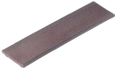
ソ201-11-2 炭化土吹 15.0長皿 (46×12×2.5cm) ¥3,600 2204201011