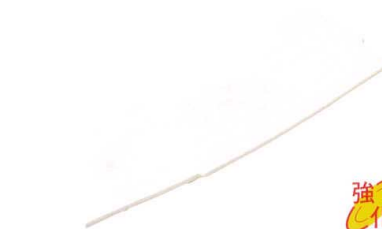
リ201-42-2 定窯木目 13.0長皿 (40×13.5×3.5cm) ¥2,340 2129193021