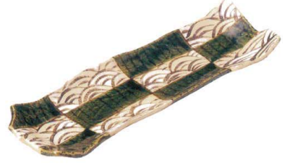
ソ201-13-2 織部錆紋 長角皿 (38.5×13×4.5cm) ¥2,800 2221201013