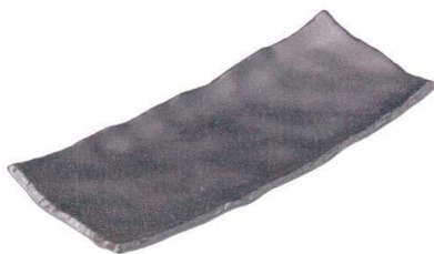
ケ201-41-2 荒黒 長角大盛皿 (35.7×15.3×3.5cm) ¥2,850 2030191052