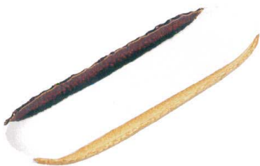
モ201-31-2 アメ塗分 14.0舟型トレー (42×14×3.1cm) ¥2,500 2124194031