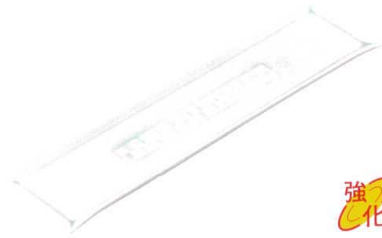
リ201-12-2 青白磁市松彫 44cm長皿 (44×11×2cm) ¥3,600 2229201012