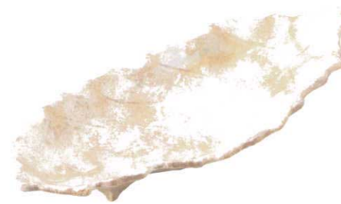
ホ201-52-2 御本手粉引 葉形大皿 (41×17.5×5.5cm) ¥2,400 2200201052 ホ201-53-2 御本手粉引 葉形中皿 (26×11×3.5cm) ¥750 2200201053