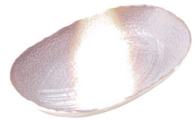
ホ201-43-2 かすみ志野 11号小判大皿 (34.5×21.8×4.5cm) ¥1,800 2100192043