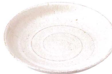
キ205-42-2 白萩 8.0皿 (φ25.5×3.8cm) ¥2,700 1813422043