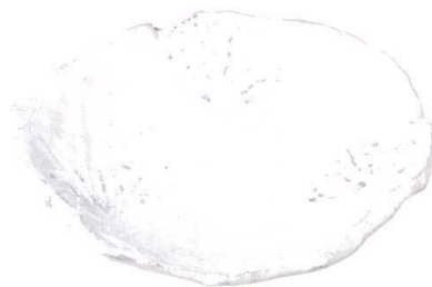
ミ205-41-2 粉引彫刻変形27cm丸皿 (27.2×26×4.3cm) ¥2,800 2223205041