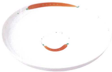
ス205-11-2 赤絵とうがらし 8.0丸皿 (φ25×3.7cm) ¥3,400 1426275026