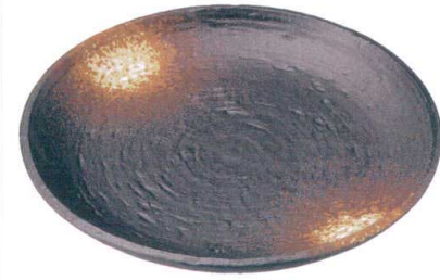
ス205-43-2 吹黒備前丸9.0皿 (φ27.5×3cm) ¥2,500 2126196023