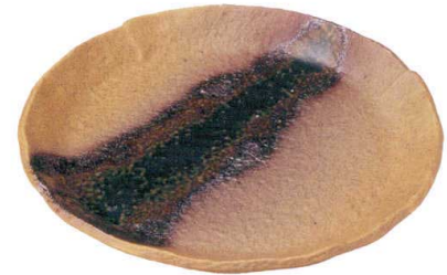
モ205-24-2 星雲伊賀 9.0丸皿 (28.5×2.5cm) ¥2,950 2124196013