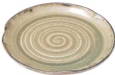
モ205-31-2 灰釉 8.5丸皿 (φ25.5×3.5cm) ¥2,600 2024197011