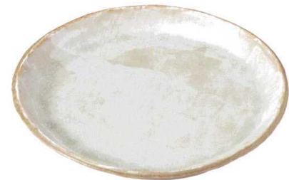
モ205-33-2 白雲 9.0丸皿 (27.5×2.5cm) ¥2,800 2024196042