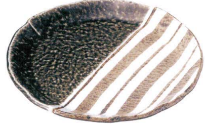
モ205-13-2 織部ストライプ 9.0丸皿 (φ28.5×2.4cm) ¥3,150 2224205013