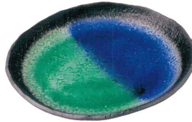
モ205-22-2 彩釉塗り分 10.0小判皿 (28.5×25.7×3cm) ¥3,000 2124200022 モ205-23-2 彩釉塗り分 8.0小判皿 (24.5×22.5×3.3cm) ¥2,400 2124200023