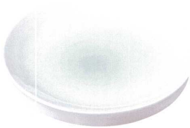
リ205-21-2 青白磁六兵衛 8.0ハイプレート (φ24.5×3cm) ¥3,000 2129197043