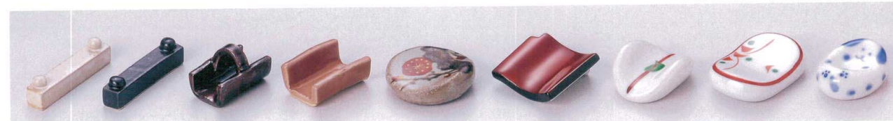
ワ237-41-2 白マット双玉 ¥360 2109232054 (5.4×1×1.5cm) ワ237-42-2 黒マット双玉 ¥360 2109232057 (5.4×1×1.5cm) ワ237-43-2 天目手提 ¥450 2109231053 (3.5×2.3×2.5cm) ワ237-44-2 ピンクU型 ¥360 2109232048 (3.5×2.5×1.5cm) ミ237-45-2 錦梅玉 ¥400 1423197021 ソ237-46-2 赤瓦 ¥450 1221187028 テ237-47-2 おはじき ¥400 1222187016 モ237-48-2 赤絵小花豆形 ¥390 1424197045 ミ237-49-2 水玉犬(青) ¥480 1823220068