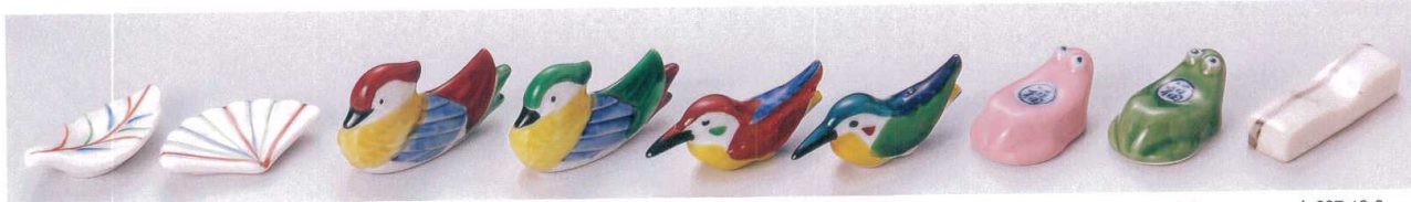
ヒ237-11-2 ボン葉形手書 ¥400 1217184035 ヒ237-12-2 ボン扇形手書 ¥400 2017231035 (5.6cm) ミ237-13-2 おしどり(赤) ¥480 1223185052 ミ237-14-2 おしどり(グリーン) ¥480 1223185051 ミ237-15-2 かわせみ(赤) ¥480 1223185054 ミ237-16-2 かわせみ(青) ¥480 1223185053 ヒ237-17-2 福カエル(ピンク) ¥430 2017230068 (4.7cm) ヒ237-18-2 福カエル(グリーン) ¥430 2017230067 (4.7cm) ヒ237-19-2 ねり込 ¥470 1217185021