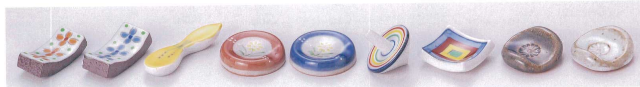
キ237-31-2 花つなぎ(赤) ¥450 2113231042 (5.4cm) キ237-32-2 花つなぎ(青) ¥450 2113231043 (5.4cm) ミ237-33-2 黄ひさご ¥380 1223184058 ス237-34-2 夢草花(ピンク) ¥450 1626198022 (φ4.7cm) ス237-35-2 夢草花(ブルー) ¥450 1226184038 (φ4.7cm) ミ237-36-2 こま ¥480 1223184057 リ237-37-2 錦奴 ¥500 1429197047 (4×4×1.5cm) キ237-38-2 藍釉印花 ¥400 1813221061 キ237-39-2 印花(白天目) ¥400 1213185013