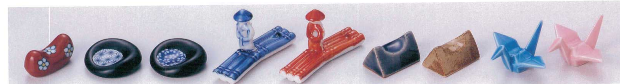
ミ237-51-2 散し花(赤) ¥480 182321028 ミ237-52-2 刺子丸 ¥380 2123232064 (φ5cm) ミ237-53-2 小花丸 ¥380 2123232063 (4cm) ミ237-54-2 いかだ青 ¥380 2123232061 (7.5×4cm) ミ237-55-2 いかだ赤 ¥380 2123232062 (7.5×4cm) エ237-56-2 三角藍釉 ¥300 1415199012 (3.7cm) エ237-57-2 三角信楽 ¥300 1415199011 (3.7cm) ヒ237-58-2 オリヅル(ブルー) ¥380 2017231042 (4.5cm) ヒ237-59-2 オリヅル(ピンク) ¥380 2017231041 (4.5cm)