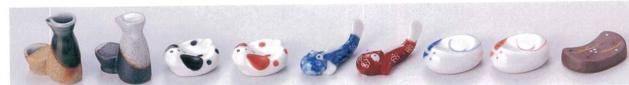
ミ237-61-2 織部酒 ¥300 2223237061 (φ5cm) ミ237-62-2 益子酒 ¥300 2223237062 (φ5cm) ミ237-63-2 福犬水玉(黒) ¥340 2023231061 (4×3.5cm) ミ237-64-2 福犬水玉(赤) ¥340 2023231062 (4×3.5cm) ミ237-65-2 こち(青) ¥350 1223185057 ミ237-66-2 こち(赤) ¥350 1223185058 ミ237-67-2 玉うさぎ青 ¥300 2123234013 (4.5cm) ミ237-68-2 玉うさぎ赤 ¥300 2123234012 (4.5cm) ミ237-69-2 南蛮むさしの ¥320 1223187025

刺身鉢 千代口 向付 中鉢 小鉢 小付 珍味入 松花堂 蓋向付 煮物碗 小吸碗 蒸し鍋 土瓶蒸し 焼物皿 仕切り皿 突出血 粘皿 多用皿鉢 煎茶皿 天皿 香水 和皿 銘々皿 小皿 盛皿・鉢 大皿・鉢 組鉢 組鉢 焼酎 カップ ゴブレット 酒器 卓上小物 調理用品