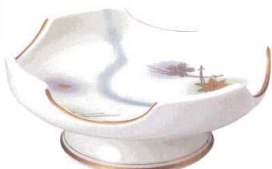
ツ245-3-2 高台向付 (φ15.5×6cm) ¥3,000 1221203003