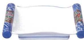
ケ245-32-2 巻物刺身皿 (18.8×13.5×4.5cm) ¥2,250 1430206012