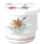
ツ245-8-2 ミニ蒸し碗 (φ6.5×7cm) ¥2,450 1221203011