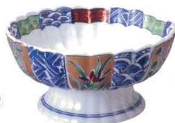
ケ245-23-2 菊型刺身鉢 (φ15×7.5cm) ¥3,300 1430206003