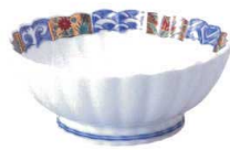
ケ245-28-2 菊型香水 (φ11×4.6cm) ¥1,480 1430206002