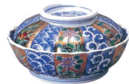
ケ245-29-2 菊型蓋向付 (φ14.8×8.2cm) ¥4,800 1430206007