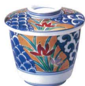
ケ245-21-2 蒸し碗 (φ10×8.7cm) ¥2,700 1430206008