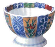
ケ245-25-2 菊型3.6小鉢 (φ10.2×7cm) ¥2,350 1430206006