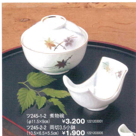
ツ245-1-2 煮物碗 (φ11.5×9cm) ¥3,200 1221203001 ツ245-2-2 両切3.5小鉢 (10.5×6.5×5.5cm) ¥1,900 1221203005