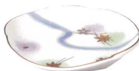
ツ245-12-2 天皿 (φ20×20×3cm) ¥2,850 1221203007