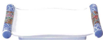
ケ245-30-2 巻物焼物皿 (21.5×12.5×3.5cm) ¥2,200 1430206010