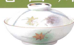
ツ245-5-2 蓋向付 (φ13.3×7.8cm) ¥3,500 1221203008