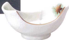
ツ245-7-2 両切4.3小鉢 (13.3×8.5×6cm) ¥2,100 1221203006