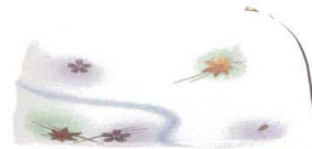
ツ245-13-2 焼物皿 (18×15×4cm) ¥2,100 1221203013