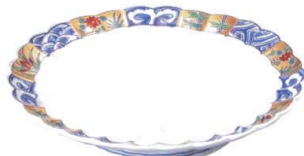
ケ245-27-2 菊型6.0天皿 (φ19.8×4cm) ¥2,700 1430206001