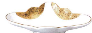
ケ246-13-2 木甲型前菜皿 (20.2×12×4.3cm) ¥2,100 1430212005