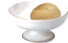
ケ246-1-2 丸高台刺身鉢 (φ15.5×7.8cm) ¥3,050 1430212001