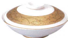
ケ246-9-2 新平蓋向付(小) (φ15.8×7.5cm) ¥3,050 1430212012