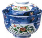
ソ246-23-2 円菓子碗 (φ12.5×11.5cm) ¥2,700 1204221022