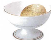
ケ246-3-2 丸高台小鉢 (φ11×7.5cm) ¥2,550 1430212003