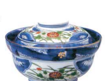
ソ246-36-2 大名井 (φ16.5×10.3cm) ¥3,200 1204221021