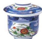
ソ246-28-2 むし碗 (φ8.3×9.3cm) ¥2,150 1204221033