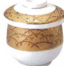
ケ246-10-2 割型玉蒸し碗 (φ7×8.8cm) ¥2,550 1430212011