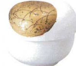
ケ246-11-2 玉蒸し碗 (φ9.5×8.5cm) ¥2,250 1430212009