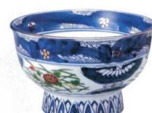
ソ246-35-2 雪輪香水 (φ12×5.5cm) ¥1,420 1204221034