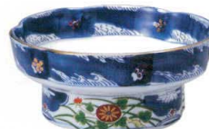
ソ246-24-2 刺身鉢 (φ15.5×6.5cm) ¥2,200 1204221025