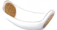
ケ246-4-2 簡型小鉢 (17×7.7×7cm) ¥2,550 1430212004