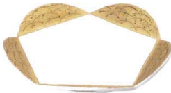
ケ246-14-2 五ツ山天皿 (19×2.5cm) ¥2,550 1430212014