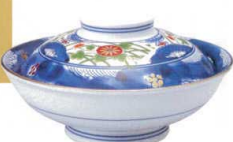
ソ246-22-2 蓋向付 (φ17.5×8.5cm) ¥2,650 1204221024