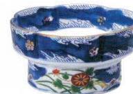
ソ246-30-2 4.0小鉢 (φ11.5×6cm) ¥1,780 1204221028 ソ246-31-2 4.5小鉢 (φ13×6.5cm) ¥1,820 1204221027