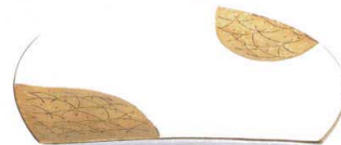
ケ246-15-2 半月天皿 (23.7×17.5×3cm) ¥3,050 1430212015