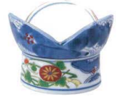
ソ246-32-2 三ツ山珍味 (φ8.5×6cm) ¥1,550 1204221029