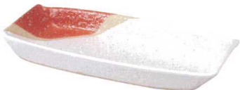
セ259-22-2 船型8.5鉢 (26×12×2.8cm) ¥2,220 1832278009