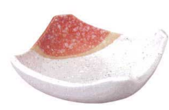
セ259-28-2 正角4.5鉢 (13.5×13.5×3.8cm) ¥1,540 1832278011