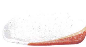
セ259-26-2 半月浜付7.0皿 (21×18×2.4cm) ¥2,220 1832278018