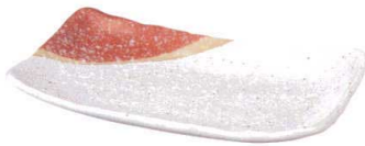
セ259-19-2 8.0長角皿 (23.3×14×2.8cm) ¥1,690 1832278001