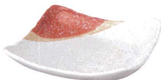
セ259-25-2 正角10.0皿 (23×23×4.9cm) ¥3,970 1832278028