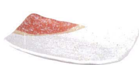
セ259-18-2 7.0長角皿 (19.3×12.3×2.3cm) ¥1,170 1832278026