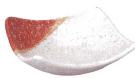
セ259-27-2 菱形7.0鉢 (21×19.7×5cm) ¥2,100 1832278012