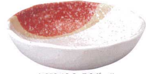
セ259-12-2 7.0ボール (φ20.5×5.5cm) ¥2,920 1832278004