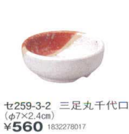
セ259-3-2 三足丸千代口 (φ7×2.4cm) ¥560 1832278017