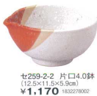
セ259-2-2 片口4.0鉢 (12.5×11.5×5.9cm) ¥1,170 1832278002