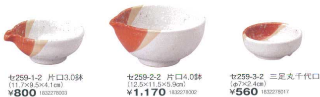
セ259-1-2 片口3.0鉢 (11.7×9.5×4.1cm) ¥800 1832278003