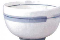
ケ262-16-2 夏目5.5井 (φ16.5×10.5cm) ¥2,400 2030271010