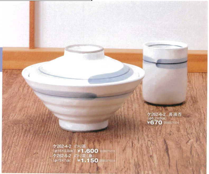
ケ262-6-2 長湯呑 (φ6.2×8cm) ¥670 2030271024