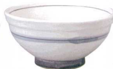
ケ262-10-2 玉洲6.0井 (φ19.2×9cm) ¥1,850 2030271006