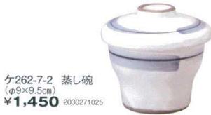
ケ262-7-2 蒸し碗 (φ9×9.5cm) ¥1,450 2030271025