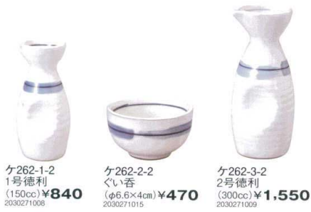
ケ262-1-2 1号徳利 (150cc) ¥840 2030271008