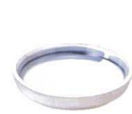
ケ262-18-2 薬味皿 (φ9.2×1.8cm) ¥460 2030271026