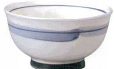
ケ262-11-2 高浜5.8井 (φ17.4×9.5cm) ¥2,250 2030271007