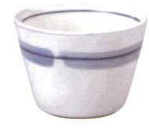
ケ262-19-2 そば猪口 (φ8.5×6.2cm) ¥620 2030271002