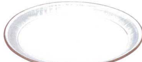
モ264-30-2 7.0丸皿(リム) (φ21.6×2.5cm) ¥2,200 2224264030 モ264-31-2 8.0丸皿(リム) (φ25×3cm) ¥3,200 2224264031