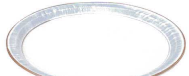
モ264-33-2 10.0丸皿(リム) (φ31.7×3.4cm) ¥8,000 2224264033