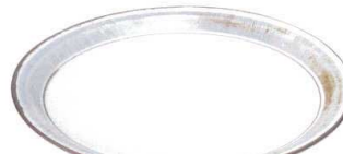
モ264-32-2 9.0丸皿(リム) (φ27.8×3.2cm) ¥3,800 2224264032