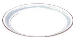
モ264-28-2 5.5丸皿 ¥1,320 2224264028 モ264-29-2 6.5丸皿 ¥1,900 2224264029