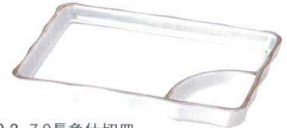
モ264-10-2 7.0長角仕切皿 (19×13.2×2.5cm) ¥1,200 2224264010