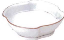
モ264-1-2 ねじり刺身鉢 (15×15×5cm) ¥1,850 2224264001