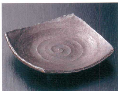
ツ27-21-2 灰釉四ツ足 角皿(大) (18.5×18.5×4.3cm) ¥2,600 2221027021