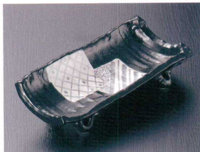
ス27-12-2 黒織部 ロクロ目向付 (20.5×10.5×5.8cm) ¥2,700 2026020021