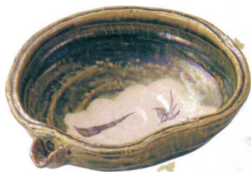
リ27-11-2 織部ツバメ 片口向付 (19.5×16.5×5.6cm) ¥2,670 2029021013