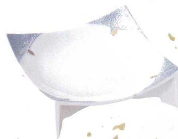
ケ27-33-2 ブルー吹ラスター 正角皿 (14×4.7cm) ¥2,450 2130020041