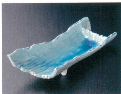
ソ27-41-2 マリンブルー 竹割型向付 (30.5×13×7.5cm) ¥2,250 2204027041