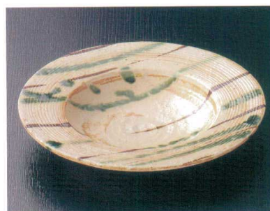
リ27-23-2 織部流し 6.5浅鉢 (φ20×3.5cm) ¥2,600 2129017043