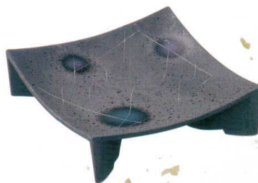
ケ27-13-2 黒マット線彫 正角皿(大) (19.5×6cm) ¥2,700 2130013034