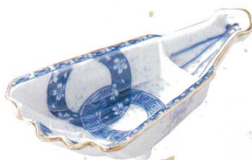
リ27-31-2 染付丸紋 扇面向付 (22.2×12×5.5cm) ¥2,530 2229027031