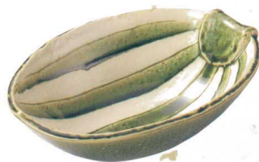
ツ27-42-2 織部十草 楕円鉢 (18.2×13.2×5.6cm) ¥2,200 2221027042