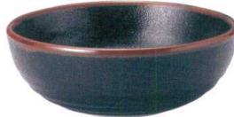
ケ275-19-2 6.5ボール (φ19.5×7cm) ¥2,200 2030258006