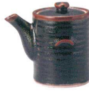
ケ275-4-2 4号ダシ入 (400cc) ¥1,550 2030259008