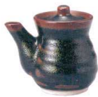
ケ275-2-2 正油入(小) (160cc) ¥1,050 2030259003