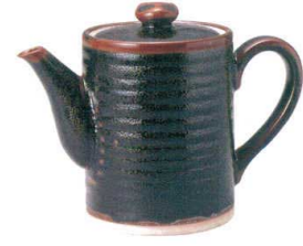
ケ275-5-2 6号ダシ入 (800cc) ¥3,000 2030259009