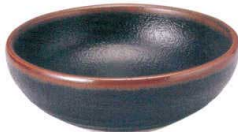
ケ275-18-2 4.8ボール (φ14.5×4.6cm) ¥880 2030258009