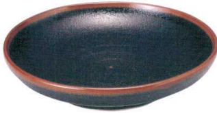
ケ275-1-2 7.5めん皿 (φ22.5×5.2cm) ¥1,950 2030259011