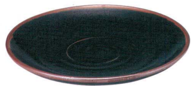
ケ275-27-2 丸10.0皿 (φ30.8cm) ¥6,300 2030258023