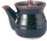
ケ275-3-2 正油入(大) (250cc) ¥1,200 2030259012