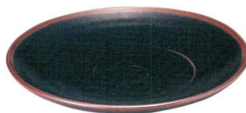
ケ275-26-2 丸9.0皿 (φ27.6cm) ¥4,400 2030258022