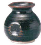
ケ275-8-2 2号そば徳利 (300cc) ¥1,200 2030259016