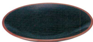
ケ275-25-2 丸8.0皿 (φ24.8cm) ¥2,500 2030258021