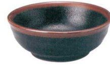
ケ275-10-2 丸取鉢 (φ12.2×4.6cm) ¥750 2030258018