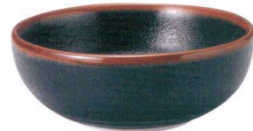
ケ275-20-2 7.0ボール (φ21×7.7cm) ¥3,000 2030258007