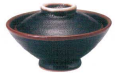
ケ275-15-2 のり茶 (φ16×9cm) ¥1,480 2030259006 ケ275-16-2 のり茶(身) (φ16×6.8cm) ¥880 2030259007