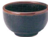
ケ275-14-2 夏目4.0井 (φ12×7.5cm) ¥1,200 2030258015