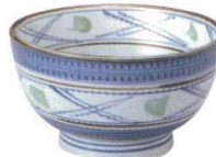
ヤ296-7-2 5.5高浜井 (φ16.5×9.7cm) ¥1,600 2010304025