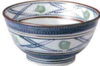
ヤ296-9-2 5.5多用井 (φ17.3×8.8cm) ¥1,380 2010304032