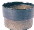
ヤ296-27-2 そば千代口 (φ9×6.5cm) ¥710 2010304003