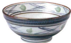
ヤ296-6-2 6.0玉淵井 (φ18.8×8.5cm) ¥1,800 2010304027