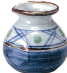
ヤ296-3-2 そば徳利 (φ8×8cm 180cc) ¥880 2010304022