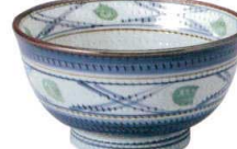
ヤ296-11-2 6.0高浜井 (φ18.5×10cm) ¥1,900 2010304026