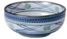
ヤ296-4-2 6.0ボール (φ18.5×8cm) ¥1,800 2010304029