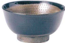
ヤ296-29-2 6.0高浜井 (φ18.2×10cm) ¥1,860 2010304006