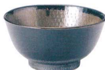
ヤ296-30-2 5.5多用井 (φ17×9cm) ¥1,280 2010304012