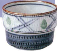
ヤ296-2-2 そば千代口 (φ9×6.5cm) ¥740 2010304023