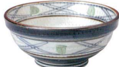
ヤ296-10-2 6.8玉淵井 (φ20.4×9.3cm) ¥2,120 2010304024