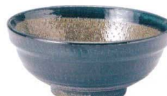
ヤ296-31-2 6.8玉淵井 (φ20.3×9cm) ¥1,900 2010304004