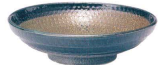
ヤ296-25-2 7.0麺皿 (φ21.3×5.7cm) ¥1,550 2010304011