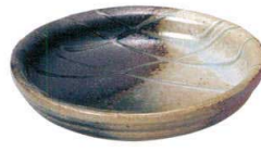
ホ299-35-2 中鉢 (φ21×4.5cm) ¥2,000 1800331011