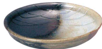
ホ299-36-2 大鉢 (φ29×7cm) ¥4,300 1800331010