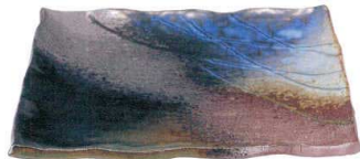
ホ299-28-2 正角皿 (24×24×3.8cm) ¥2,800 1800331018