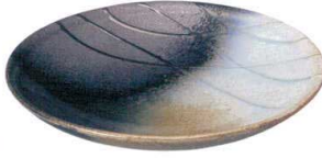
ホ299-29-2 8号丸皿 (φ24×3.8cm) ¥2,200 1800331012