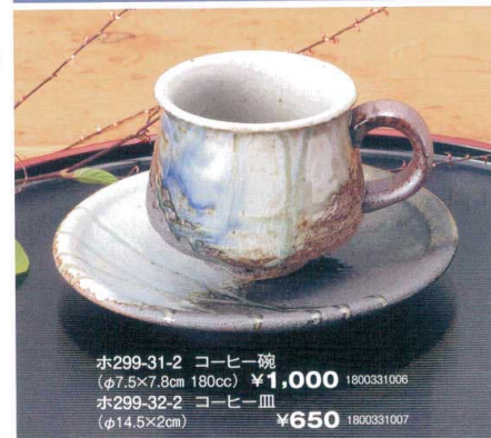
ホ299-31-2 コーヒー碗 (φ7.5×7.8cm 180cc) ¥1,000 1800331006