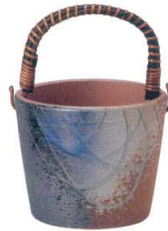
ホ299-30-2 つる付アイスパール (φ12.8×10.5cm) ¥1,700 2000219021