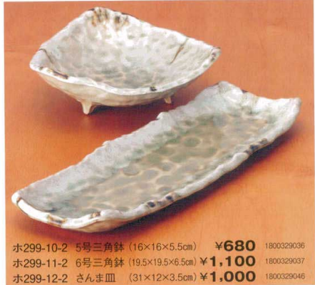
ホ299-10-2 5号三角鉢 (16×16×5.5cm) ¥680 1800329036