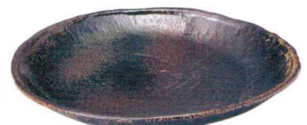
ホ300-39-2 9号丸皿 (φ27×4cm) ¥2,000 2000313023 ホ300-40-2 10号丸皿 (φ30×4.5cm) ¥3,000 2000313024