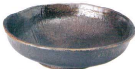
ホ300-34-2 10号盛鉢 (30×28.5×8cm) ¥4,300 2000313001 ホ300-35-2 8号盛鉢 (24.5×23×7cm) ¥2,100 2000313007