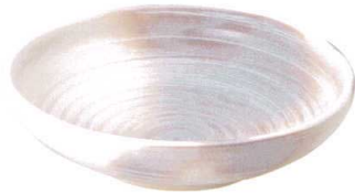
☎300-1-2 8号めん鉢 (φ24.3×6.7cm) ¥1,950 1828331024