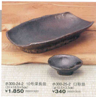
ホ300-24-2 10号深長皿 (31×18.5×5cm) ¥1,850 2000313003