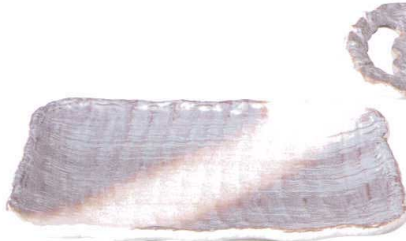
☎300-9-2 11号長角皿 (34×28×4cm) ¥2,250 1828331026