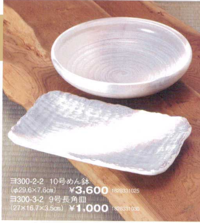
☎300-2-2 10号めん鉢 (φ29.6×7.6cm) ¥3,600 1828331025 ☎300-3-2 9号長角皿 (27×16.7×3.5cm) ¥1,000 1828331030