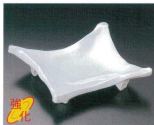
リ33-53-2 青白磁 ちぎり向付 (19.5×18.5×5cm) ¥1,800 2029025044