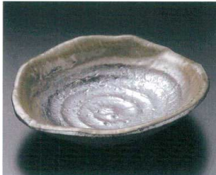
ケ33-21-2 備前なぶり手 5.0鉢 (17.5×16×4cm) ¥1,900 2230033021