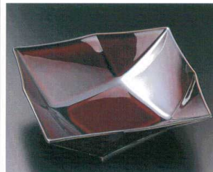
キ33-33-2 漆ブラウン 折目皿 小 (15×15×5cm) ¥1,850 2013146052