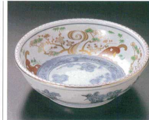
ソ33-14-2 古錦松竹梅 5.5向付 (φ16.4×5.3cm) ¥1,900 2204033014