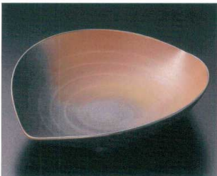
ル33-41-2 窯変すげ傘 向付 (16.2×14.7×4cm) ¥1,850 1805029052