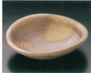
リ33-12-2 美膳金タタキ たわみ鉢 (17.2×16×4.2cm) ¥1,900 1629029014