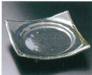
リ33-32-2 (手造り)織部 四方皿 (16.8×16.8×4cm) ¥1,870 2129025013