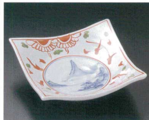
ソ33-43-2 古染万暦山水 正角向付 (15×15×4.8cm) ¥1,800 1621030024