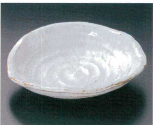
ケ33-51-2 粉引なぶり手 5.0鉢 (18×16×4.5cm) ¥1,800 1830029044