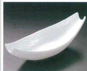
ケ33-54-2 白釉 舟型向付 (25.3×10×7.3cm) ¥1,780 2030025051