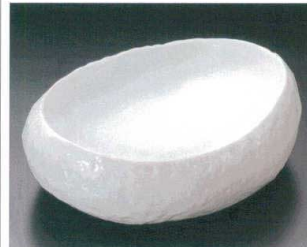
ウ33-23-2 白 夕円向付 (19×15×6.5cm) ¥1,860 2201033023