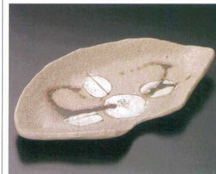
マ33-44-2 椿 扇皿 (19.6×11.2×2.1cm) ¥1,800 1807029014