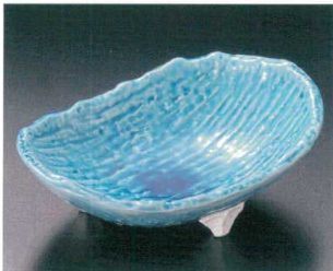
リ33-31-2 トルコ青砂目なぶり 向付 (19.5×13.8×6cm) ¥1,870 1429030054