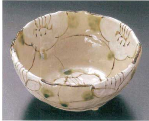
ソ33-11-2 格子花 三ツ足5寸鉢 (φ15.3×7cm) ¥1,900 1804029023