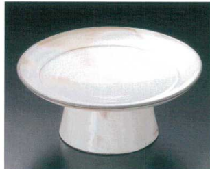
ワ33-22-2 御本手 高台皿 (φ15×6.2cm) ¥1,880 1809028043