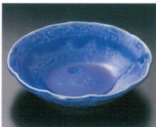
ス33-52-2 青釉 6.0鉢 (φ18×4.5cm) ¥1,800 12262243006