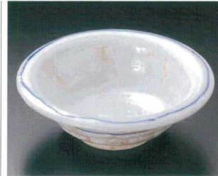
セ33-13-2 ゆきみち 反6.0鉢 (φ18.7×6cm) ¥1,900 1832039012