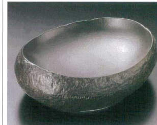
ウ33-24-2 黒 夕円向付 (19×15×6.5cm) ¥1,860 2101023041