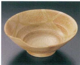
マ33-42-2 灰釉たすき掛 向付 (φ13.7×5.1cm) ¥1,800 1407039051