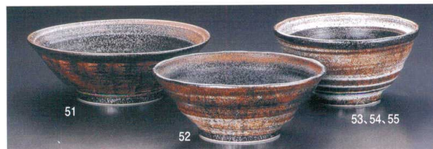
51 52 53, 54, 55 チ345-51-2 古窯 けずり80井 (φ24.5×8.5cm) ¥3,000 2108337051 チ345-52-2 古窯 けずり68井 (φ21×8.5cm) ¥1,800 2108337052 チ345-53-2 古窯 鳴門麺井 (φ20.2×10.3cm) ¥1,800 2108337053 チ345-54-2 古窯 鳴門60井 (φ19×9.8cm) ¥2,200 2108337054 チ345-55-2 古窯 鳴門50井 (φ16.5×8.5cm) ¥1,350 2108337055