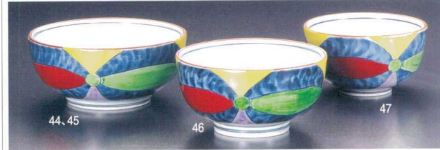
44, 45 46 47 ハ345-44-2 紙ふうせん 6.0多用井 (φ18×8.5cm) ¥3,900 1206307015 ハ345-45-2 紙ふうせん 5.5多用井 (φ16.7×9cm) ¥3,600 1206307014 ハ345-46-2 紙ふうせん 4.8多用井 (φ14.5×8.5cm) ¥2,600 1206307012 ハ345-47-2 紙ふうせん 4.2井 (φ12.9×7.4cm) ¥2,200 1206307011