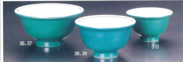
36, 37 38, 39 310 ハ345-36-2 グリーン吹き 6.5反玉測井 (φ19.7×10.2cm 1300cc) ¥3,000 2006357036 ハ345-37-2 グリーン吹き 5.8反玉測井 (φ18.2×10.2cm 1150cc) ¥2,500 2006357037 ハ345-38-2 グリーン吹き 5.3反玉測井 (φ16.6×10cm 950cc) ¥2,200 2006357038 ハ345-39-2 グリーン吹き 4.8反玉測井 (φ15.5×9.7cm 800cc) ¥1,700 2006357039 ハ345-310-2 グリーン吹き 4.3反玉測井 (φ13.5×8.5cm 500cc) ¥1,300 2006357310