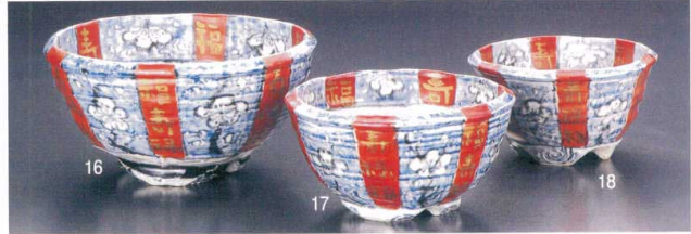
16 17 18 ソ345-16-2 赤絵福寿梅濃 7.0井 (φ20.8×10.6cm) ¥3,960 1604326011 ソ345-17-2 赤絵福寿梅濃 5.5井 (φ17.2×9cm) ¥3,400 1604326012 ソ345-18-2 赤絵福寿梅濃 4.5井 (φ14.8×8.5cm) ¥2,200 1604326013