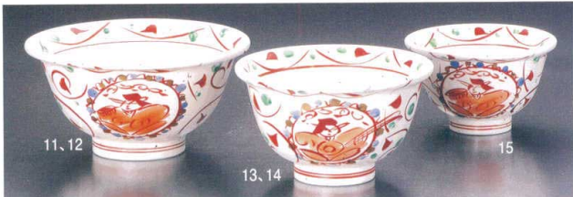
11, 12 13, 14 15 ハ345-11-2 萩粉引姫丸紋 6.5反玉測井 (φ19.7×10.2cm 1300cc) ¥3,600 2006356014 ハ345-12-2 萩粉引姫丸紋 5.8反玉測井 (φ18.2×10.2cm 1150cc) ¥3,300 2006356015 ハ345-13-2 萩粉引姫丸紋 5.3反玉測井 (φ16.6×10cm 950cc) ¥2,800 2006356016 ハ345-14-2 萩粉引姫丸紋 4.8反玉測井 (φ15.5×7cm 800cc) ¥2,400 2006356017 ハ345-15-2 萩粉引姫丸紋 4.3反玉測井 (φ13.5×8.5cm 500cc) ¥2,000 2006356018