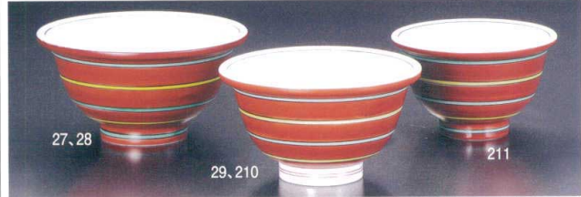
27, 28 29, 210 211 ハ345-27-2 源氏巻 6.5反玉測井 (φ19.7×10.2cm 1300cc) ¥3,200 2006357041 ハ345-28-2 源氏巻 5.8反玉測井 (φ18.2×10.2cm 1150cc) ¥2,700 2006357042 ハ345-29-2 源氏巻 5.3反玉測井 (φ16.6×10cm 950cc) ¥2,400 2006357043 ハ345-210-2 源氏巻 4.8反玉測井 (φ15.5×9.7cm 800cc) ¥1,800 2006357044 ハ345-211-2 源氏巻 4.3反玉測井 (φ13.5×8.5cm 500cc) ¥1,400 2006357045