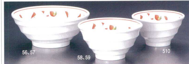
56, 57 58, 59 510 ト345-56-2 鳴門うず赤絵 6.8井 (φ20.5×8.5cm) ¥1,300 2216345056 ト345-57-2 鳴門うず赤絵 6.5井 (φ9.5×8cm) ¥1,100 2216345057 ト345-58-2 鳴門うず赤絵 5.5井 (φ16×8.5cm) ¥1,160 2216345058 ト345-59-2 鳴門うず赤絵 5.0井 (φ14.8×8cm) ¥1,080 2216345059 ト345-510-2 鳴門うず赤絵 4.5井 (φ13.8×8cm) ¥900 2216345510