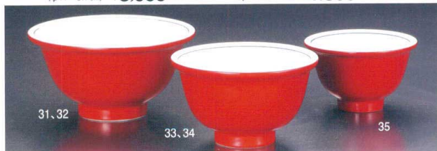
31, 32 33, 34 35 ハ345-31-2 赤吹き 6.5反玉測井 (φ19.7×10.2cm 1300cc) ¥3,200 2006357024 ハ345-32-2 赤吹き 5.8反玉測井 (φ18.2×10.2cm 1150cc) ¥2,900 2006357025 ハ345-33-2 赤吹き 5.3反玉測井 (φ16.6×10cm 950cc) ¥2,400 2006357026 ハ345-34-2 赤吹き 4.8反玉測井 (φ15.5×9.7cm 800cc) ¥2,000 2006357027 ハ345-35-2 赤吹き 4.3反玉測井 (φ13.5×8.5cm 500cc) ¥1,500 2006357028