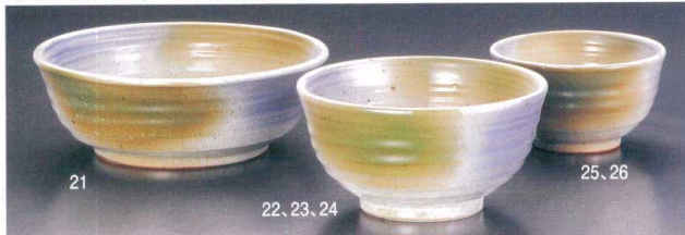
21 22, 23, 24 25, 26 ハ345-21-2 紫緑園 7.0ボール (φ21.5×8cm) ¥4,400 1206306016 ハ345-22-2 紫緑園 6.0井 (φ18.5×9cm) ¥3,500 1206306015 ハ345-23-2 紫緑園 5.5井 (φ17×8.7cm) ¥3,000 1206306014 ハ345-24-2 紫緑園 5.0井 (φ15.5×9cm) ¥2,500 1206306013 ハ345-25-2 紫緑園 4.5井 (φ14×8.5cm) ¥2,000 1206306012 ハ345-26-2 紫緑園 4.0井 (φ12.5×7cm) ¥1,800 1206306011