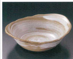
キ35-53-2 灰粉引 多用鉢 (19.3×16×5.5cm) ¥1,250 2213035053