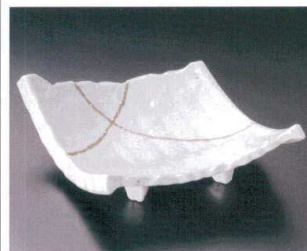
ウ35-43-2 白一珍 四ツ足瓦皿 (17×18×7cm) ¥1,300 2001140052