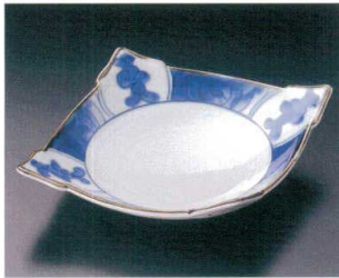
リ35-11-2 染付芙蓉 菱型皿 (20.5×18×4cm) ¥1,650 2229035011