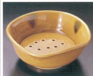
ツ35-33-2 黄瀬戸 どうふ鉢(水切り付) (14.5×14.5×5cm) ¥1,300 2121033044