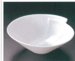
テ35-54-2 うすあさぎ 向付 (φ17×5cm) ¥1,250 2011027013