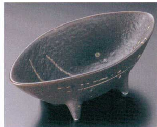
ウ35-22-2 筆流し黒 四ツ足中鉢 (21×10.3×6.5cm) ¥1,080 2201035022