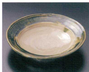
リ35-52-2 測織部 5.5深皿 (φ17×3.5cm) ¥1,280 1829031053