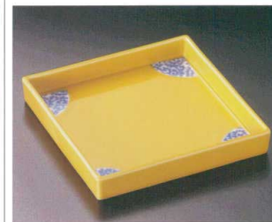
ツ35-44-2 染付黄タコ唐草 切立皿 (16.8×16.8×2.5cm) ¥1,300 2021027014