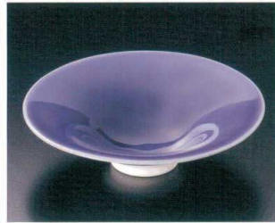
リ35-12-2 バイオレット 反方向付 (φ16.2×4.1cm) ¥1,640 2129025032