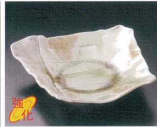
ツ35-13-2 灰釉ビードロ 四方向付 (17×15.5×5cm) ¥1,600 2121025014