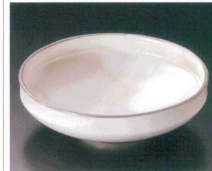
ワ35-24-2 御本手 5.0鉢 (φ15×4.8cm) ¥1,450 1809039051