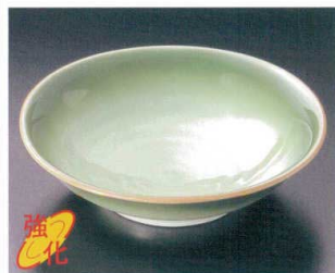
モ35-32-2 緑彩 向付 (φ15.7×4.3cm) ¥1,350 2224035032