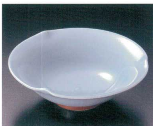
ウ35-41-2 青地 三ツ押5.0鉢 (φ16×5cm) ¥1,300 2101026012