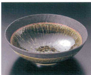
ウ35-31-2 測黒オリベ 浅鉢(小) (φ16.8×5.5cm) ¥1,400 2201035031