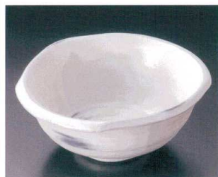
エ35-42-2 化粧流し 向付 (16×14×6.5cm) ¥1,300 1615032013