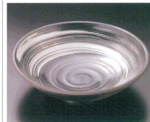
ツ35-34-2 黒釉白刷毛 6.0鉢 (φ190×50cm) ¥1,300 2221035034