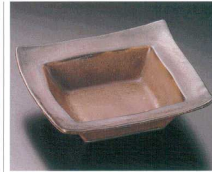
モ35-14-2 鮎 平鉢 (16.7×16.7×4.6cm) ¥1,550 2124033023