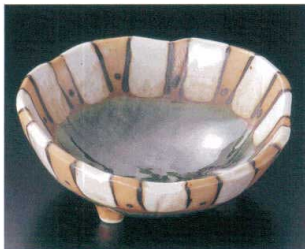
ケ35-21-2 塗織織部十草 三ツ足向付 (φ14.5×5cm) ¥1,500 1602030034