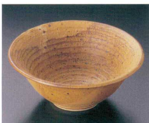
テ35-51-2 黄伊良保 向付 (φ14.5×6cm) ¥1,280 1811031031