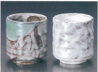
カ364-41-2 青均窯 寿司湯呑 (φ8.8×10cm) ¥830 1214330042 カ364-42-2 鬼志野 寿司湯呑 (φ8.8×10cm) ¥830 1214330043