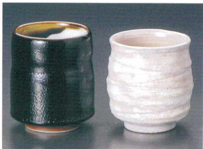
キ364-43-2 ゆず天目白形 寿司湯呑 (φ8×10cm) ¥780 1418353026 マ364-44-2 美の萩 寿司湯呑 (φ8.5×9.2cm) ¥780 1207330026