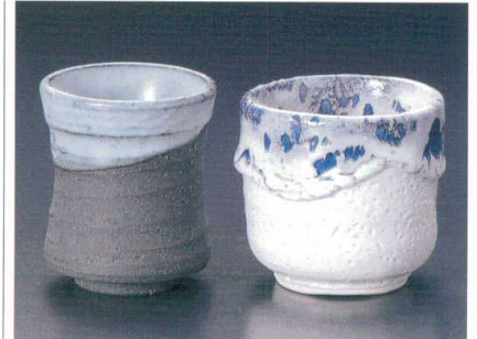
キ364-15-2 黒ミカゲ均窯 寿司湯呑 (φ8.3×10cm) ¥1,050 2113361021 キ364-16-2 窯変 寿司湯呑 (φ9.5×9cm) ¥1,000 1213330013