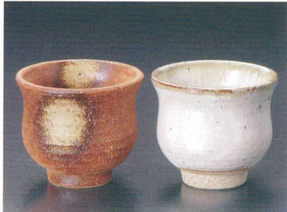
キ364-21-2 信楽風キネ大 寿司湯呑 (φ9.8×8.5cm) ¥1,000 1813386026 キ364-22-2 白萩キネ大 寿司湯呑 (φ9.8×8.5cm) ¥1,000 1813386024