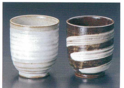
キ364-45-2 灰粉引 寿司湯呑 (φ7.9×9.2cm) ¥750 1813387016 キ364-46-2 刷毛渦 寿司湯呑 (φ7.9×9.2cm) ¥750 1613349015