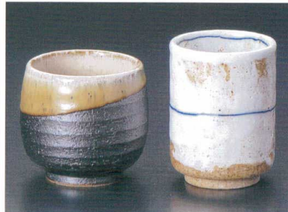
キ364-23-2 南蛮白萩 寿司湯呑 (φ8×8cm) ¥1,000 2113361024 セ364-24-2 ゆきみち 寿司湯呑 (φ7.4×10cm) ¥900 1832386032