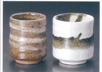
キ364-25-2 土灰釉 寿司湯呑 (φ8×9.7cm) ¥900 2113361034 キ364-26-2 うるし天目 寿司湯呑 (φ8.5×9.5cm) ¥880 2113361045