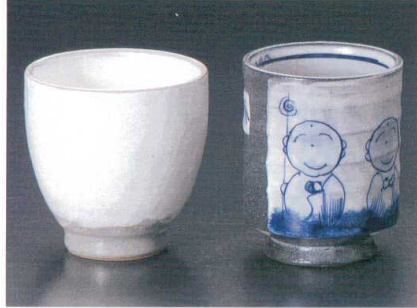
キ364-11-2 粉引しぼり 寿司湯呑 (φ8.5×8.5cm) ¥1,450 1413356024 エ364-12-2 おじぞう様 中寿司 (φ7.4×9.4cm) ¥1,400 2215364012