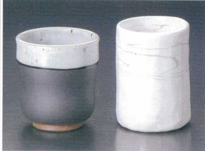
ミ364-13-2 黒半掛粉引青磁 寿司湯呑 (φ8×9.2cm) ¥1,200 2223364013 チ364-14-2 練り込み 寿司湯呑 (φ7.5×10cm) ¥1,100 2008378021