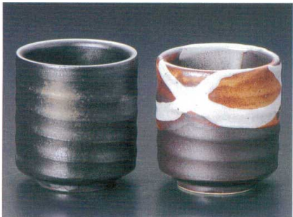
キ364-31-2 備前 寿司湯呑 (φ8.5×9.5cm) ¥880 2213364031 キ364-32-2 残雪 寿司湯呑 (φ8.5×9.5cm) ¥880 2113361046