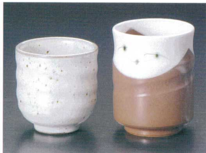
カ364-33-2 粉引青磁 寿司湯呑 (φ8.3×8.5cm) ¥880 1414352032 ミ364-34-2 グリン点紋 寿司湯呑 (φ8×10.5cm) ¥850 1423352036