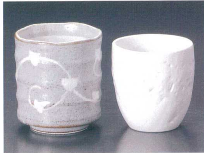
モ365-15-2 ねずみ唐草 寿司湯呑 (φ8.5×9.5cm 400cc) ¥720 2124362013