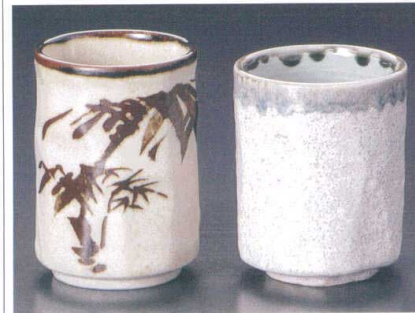
チ365-45-2 黄サビ竹 寿司湯呑(中) (φ7.2×10.5cm) ¥430 1408353045