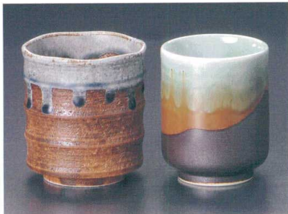
セ365-13-2 錆藍流し 寿司湯呑 (φ6.5×9.1cm) ¥730 2132361044