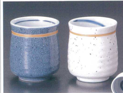
工365-35-2 大理石青 寿司湯呑 (φ7.5×9cm) ¥550 1215331036