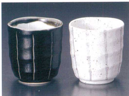
ミ365-11-2 黒十草 寿司湯呑 (φ8.5×9.5cm) ¥750 2223365011