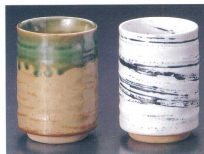
カ365-41-2 黄瀬戸 寿司湯呑 (φ7.7×11cm) ¥530 2114362041