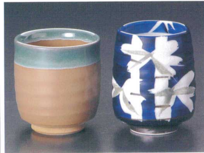
ツ365-25-2 益子流 寿司湯呑 (φ8.2×9.2cm) ¥680 1221331021