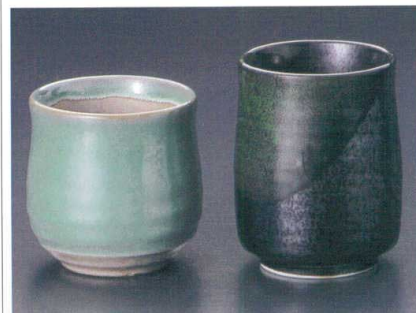
カ365-43-2 均窯 寿司湯呑 (φ7.8×8.3cm) ¥500 1614349042