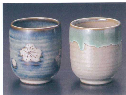
工365-31-2 散らし梅 寿司湯呑 (φ7.5×9.5cm) ¥650 2015379024