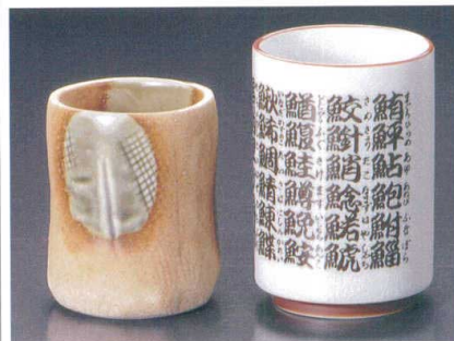
チ365-33-2 伊賀合せ 寿司湯呑 (φ7.5×9.5cm) ¥640 1408353024