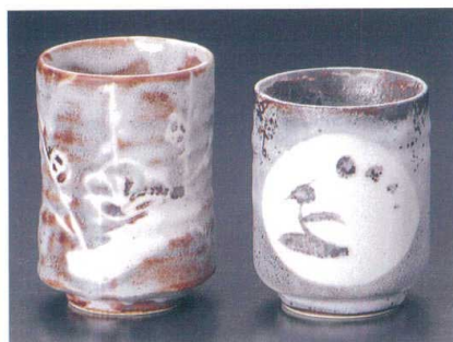
カ365-21-2 志野梅 寿司湯呑 (φ7.3×10.5cm) ¥700 2214365021