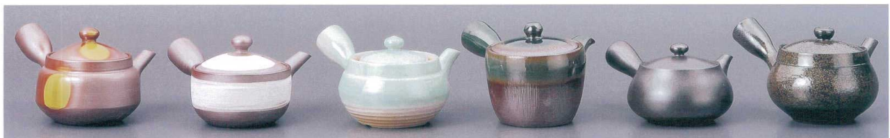
ホ387-41-2 1.5号急須 富士型梨地黄模様 (サークルアミ) (260cc) ¥1,500 2200387041 ホ387-42-2 1.5号急須 ワン型白ハゲ目 (サークルアミ) (230cc) ¥1,650 2200387042 ホ387-43-2 1.7号急須 赤坂青磁 (ボコアミ) (310cc) ¥1,800 2200387043 ホ387-44-2 萬古 2.0号千筋織部巻 (底アミ) (310cc) ¥1,900 2100384051 ホ387-45-2 1.5号急須 栗型ようがん焼 (オーバル) (230cc) ¥2,500 2200387045 ホ387-46-2 2.0号急須 カマ型石目黒金彩 (サークルアミ) (360cc) ¥2,800 2200387046