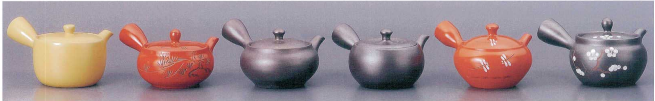
ホ387-11-2 1.8号急須 黄泥ムジ (平アミ) (320cc) ¥1,400 2200387011 (中国製) ホ387-12-2 1.7号急須 朱泥松彫 (ぐるりアミ) (300cc) ¥1,600 2200387012 (中国製) ホ387-13-2 2.0号急須 黒泥ムジ (ぐるりアミ) (360cc) ¥1,600 2200387013 (中国製) ホ387-14-2 1.8号急須 還元釉ムジ (ぐるりアミ) (320cc) ¥1,650 2200387014 (中国製) ホ387-15-2 1.8号急須 朱泥トンボ (ぐるりアミ) (320cc) ¥1,700 2200387015 (中国製) ホ387-16-2 2.0号急須 還元釉手描絵付梅 (ぐるりアミ) (370cc) ¥1,750 2200387016 (中国製)