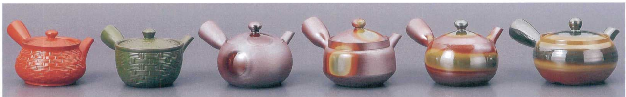
ホ387-31-2 1.5号急須 袋カゴメ 朱 (ボコアミ) (230cc) ¥1,400 2200387031 ホ387-32-2 1.5号急須 ワンカゴメ 緑 (平アミ) (220cc) ¥1,500 2200387032 ホ387-33-2 1.5号急須 ダルマ型アメ釉 (サークルアミ) (270cc) ¥1,500 2200387033 ホ387-34-2 1.5号急須 富士型梨地オリベ (サークルアミ) (260cc) ¥1,500 2200387034 ホ387-35-2 萬古 1.5号ダルマオリベ (ボコアミ) (約270cc) ¥1,650 1800405012 ホ387-36-2 2.0号平丸オリベ巻 (底アミ) (約360cc) ¥1,900 1800405021