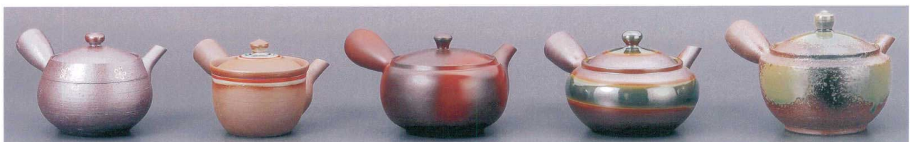
ホ387-51-2 2.0号急須 カマ型南蛮印花 (サークルアミ) (360cc) ¥2,800 2200387051 ホ387-52-2 1.5号急須 三木型コマ筋 (ペンリリー) (270cc) ¥3,300 2200387052 ホ387-53-2 3.0号急須 丸型 暁 (ボコアミ) (620cc) ¥2,650 2200387053 ホ387-54-2 3.0号急須 平丸おりべ (ボコアミ) (560cc) ¥3,400 2200387054 ホ387-55-2 3.0号急須 黒ビードロ (ペンリリー) (600cc) ¥5,500 2200387055