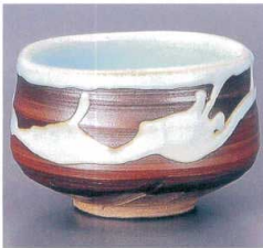
キ389-21-2 紺なまこ 抹茶碗 (φ11.6×7.8cm) ¥2,200 2113386025