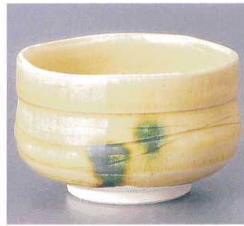
ス389-34-2 黄瀬戸 抹茶碗 (φ11.5×7.8cm) ¥2,000 1625345034