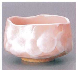
キ389-55-2 桜粉引 抹茶碗 (φ11.8×7cm) ¥1,350 2213389055