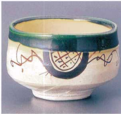
キ389-11-2 織部 抹茶碗(ボール箱入) (φ11.6×7.8cm) ¥2,200 2022403021