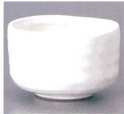
ワ389-25-2 御本手 抹茶碗 (φ11.2×6.8cm) ¥2,100 1809409043