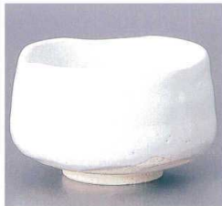
キ389-43-2 白粉引 抹茶碗 (φ11.5×7.5cm) ¥1,380 2113386044