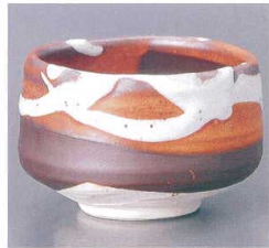
キ389-24-2 残雪 抹茶碗 (φ11.6×7.8cm) ¥2,200 2113386034