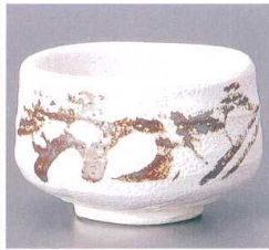
キ389-33-2 桃山志野 抹茶碗 (ボール箱入) (φ11.6×7.8cm) ¥2,000 1222327034