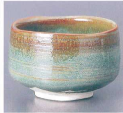
キ389-14-2 緑彩 抹茶碗(ボール箱入) (φ11.6×7.8cm) ¥2,200 2022403025