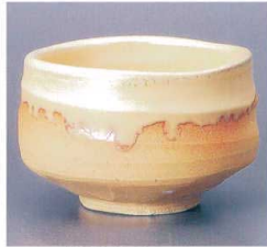
キ389-13-2 ラスター 抹茶碗 (φ11.6×7.8cm) ¥2,200 2113386023