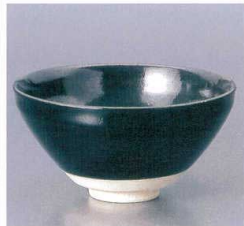
キ389-44-2 ゆず天目 夏目 抹茶碗(ボール箱入) (φ13×6.3cm) ¥1,380 2013403045