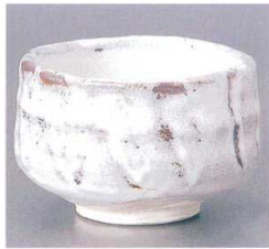
キ389-32-2 雪志野 抹茶碗 (φ11.6×7.8cm) ¥2,000 2113386012