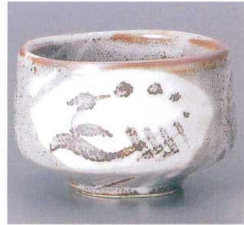
キ389-15-2 嵐志野芦 抹茶碗 (φ11.6×7.8cm) ¥2,200 2113386024