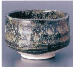
キ389-12-2 うのふ 抹茶碗(ボール箱入) (φ11.7×8.1cm) ¥2,200 1422347042