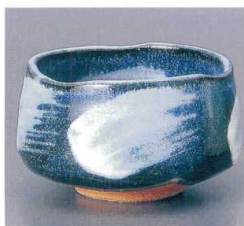
キ389-52-2 紺釉白刷毛 抹茶碗 (φ11.8×7cm) ¥1,350 2213389052