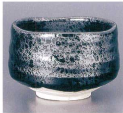
キ389-22-2 油滴 抹茶碗 (φ11.6×7.8cm) ¥2,200 2113386032