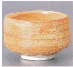
キ389-35-2 赤志野 抹茶碗(ボール箱入) (φ11.6×7.8cm) ¥2,000 1813409045