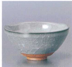
キ389-45-2 ネズミ亀甲 抹茶碗(ボール箱入) (φ13×6.3cm) ¥1,380 2013403055