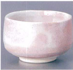
ス389-31-2 桜志野 抹茶碗 (φ11.5×7.5cm) ¥2,000 2026403035