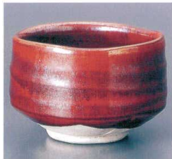
キ389-42-2 鉄赤 抹茶碗 (φ11.6×7.8cm) ¥2,000 2213389042