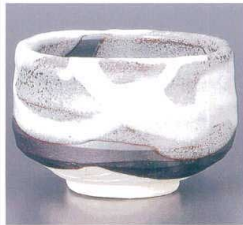
キ389-23-2 新雪 抹茶碗 (φ11.6×7.8cm) ¥2,200 2113386033