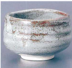
キ389-41-2 鬼志野 抹茶碗(ボール箱入) (φ11.6×7.8cm) ¥2,000 1813409044