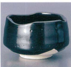
キ389-51-2 ゆず天目 抹茶碗(ボール箱入) (φ11.5×7.2cm) ¥1,380 2013403053