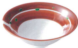
マ39-12-2 赤巻緑点 反小鉢 (φ14×5cm) ¥2,400 1407028053