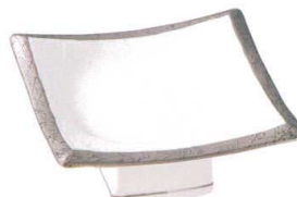
リ39-44-2 浏プラチナ 正角4.5高台皿 (13.5×13.5×5.5cm) ¥2,150 2022023023