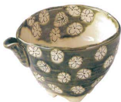
ソ39-21-2 織部春秋 片口新小鉢 (14.2×10.7×9.3cm) ¥2,250 2004031042