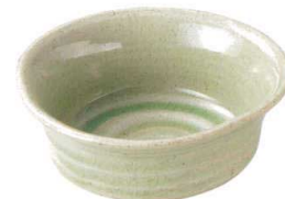
キ39-45-2 青磁 深鉢 (14.7×6cm) ¥2,200 1413041044