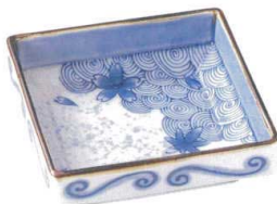
リ39-13-2 染付春秋 4.5正角鉢 (13.5×13.5×4.3cm) ¥2,400 2229039013