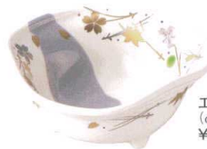
エ39-43-2 紫春秋 三ツ足小鉢 (φ13×5cm) ¥2,150 1201046022