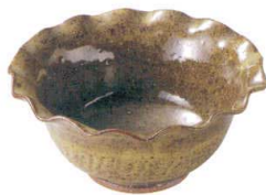
マ39-22-2 手造り灰釉 輪花鉢 (φ13.5×6.3cm) ¥2,200 1607037021