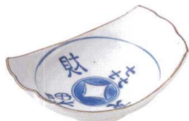
マ39-11-2 喜貴福財 船型小鉢 (15×11×5cm) ¥2,500 1207025023