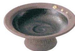
ワ39-31-2 黒柚子金彩 高台小鉢 (φ13×5.8cm) ¥2,180 1809047043