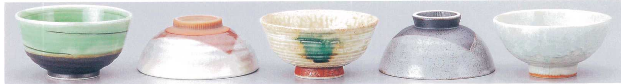
モ395-61-2 土物緑釉 茶碗(小) (φ10.5×6cm) ¥600 1427376053 モ395-63-2 掛分 中平 (φ11.7×5cm) ¥550 1427376511 モ395-65-2 イラホ織部 中平 (φ11×5.6cm) ¥570 2024405067 セ395-68-2 志野塗分 中平 (φ12×5.6cm) ¥520 1832412065 モ395-610-2 白雲 中平 (φ11×5.5cm) ¥460 2024405610 モ395-62-2 土物緑釉 茶碗(中) (φ11.7×6.2cm) ¥680 1427376054 モ395-64-2 掛分 大平 (φ12.5×5.3cm) ¥590 1427376512 モ395-66-2 イラホ織部 大平 (φ12.1×5.9cm) ¥640 2024405068 セ395-69-2 志野塗分 毛料 (φ14.1×6.5cm) ¥860 1832412066 モ395-611-2 白雲 大平 (φ12×5.8cm) ¥530 2024405611 モ395-67-2 イラホ織部 毛料 (φ13.3×6.3cm) ¥720 2024405069