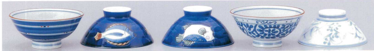
モ395-31-2 呉須巻 中平 (φ12×5.5cm) ¥290 2024409013 モ395-34-2 ヒラメ 中平 (φ12.2×5.6cm) ¥300 2024409061 モ395-37-2 フグ 中平 (φ12.2×5.6cm) ¥300 2024409064 モ395-310-2 タコ唐草 中平 (φ12×5.5cm) ¥290 2024409067 モ395-313-2 秋草 中平 (φ12.2×5.6cm) ¥240 2024409010 モ395-32-2 呉須巻 大平 (φ13.1×5.9cm) ¥340 2024409014 モ395-35-2 ヒラメ 大平 (φ13.2×5.9cm) ¥330 2024409062 モ395-38-2 フグ 大平 (φ13.2×5.9cm) ¥330 2024409065 モ395-311-2 タコ唐草 大平 (φ13.2×5.9cm) ¥340 2024409068 モ395-314-2 秋草 大平 (φ13.4×5.9cm) ¥300 2024409011 モ395-33-2 呉須巻 毛料 (φ14×6.3cm) ¥510 2024409015 モ395-36-2 ヒラメ 毛料 (φ14×6.5cm) ¥540 2024409063 モ395-39-2 フグ 毛料 (φ14×6.5cm) ¥540 2024409066 モ395-312-2 タコ唐草 毛料 (φ14×6.3cm) ¥510 2024409069