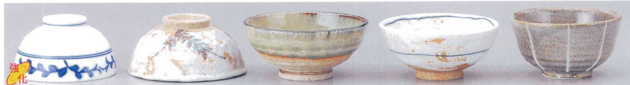
ケ395-51-2 唐草 茶碗(小) (φ10.2×5.6cm) ¥850 1830411043 モ395-53-2 志野タタキ芦 中平 (φ11.7×5.5cm) ¥860 1624369047 モ395-55-2 灰釉 中平 (φ12×5.6cm) ¥660 2024405042 セ395-57-2 ゆきみち 中平 (φ11.5×5.2cm) ¥640 1832411051 モ395-59-2 土物一珍十草 茶碗(小) (φ11×6cm) ¥600 1427376055 ケ395-52-2 唐草 茶碗(大) (φ11×6cm) ¥940 1830411044 モ395-54-2 志野タタキ芦 大平 (φ12.5×5.8cm) ¥910 1624369048 モ395-56-2 灰釉 大平 (φ13.2×6cm) ¥710 2024405043 セ395-58-2 ゆきみち 大平 (φ12.5×5.8cm) ¥700 1832411052 モ395-510-2 土物一珍十草 茶碗(中) (φ11.7×6.2cm) ¥680 1427376056