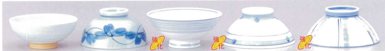
モ395-41-2 やすらぎ 中平 (φ12×5cm) ¥590 1624371031 ス395-43-2 青花つなぎ 中平 (φ11.5×5.5cm) ¥500 1826414512 ス395-45-2 駒筋 中平 (φ11.8×5.2cm) ¥480 1825414111 モ395-47-2 ダミライン 中平 (φ11.5×5.2cm) ¥460 1424373611 モ395-49-2 親子十草 中平 (φ11.8×5.4cm) ¥460 1627371011 モ395-42-2 やすらぎ 大平 (φ12.5×5.2cm) ¥630 1624371032 ス395-44-2 青花つなぎ 大平 (φ12.3×6cm) ¥580 1826414513 ス395-46-2 駒筋 毛料 (φ13.5×6.3cm) ¥680 1825414112 モ395-48-2 ダミライン 毛料 (φ13.7×6.3cm) ¥670 1424373612 モ395-410-2 親子十草 毛料 (φ13.6×6.3cm) ¥670 1627371012