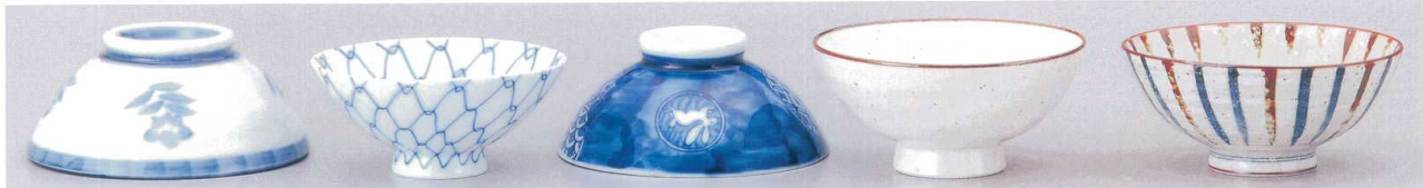
モ395-11-2 桔梗 中平(厚口) (φ11.8×5.3cm) ¥400 1224353113 モ395-13-2 内外アミ 中平 (φ11.9×5.8cm) ¥400 2024409028 モ395-15-2 京祥瑞 中平 (φ12.1×5.2cm) ¥400 2024409023 モ395-18-2 ソバ志野 中平 (φ12×5.8cm) ¥390 2024405614 ミ395-111-2 内外梨地十草 中平(赤) (φ11.5×6cm) ¥380 2023409410 モ395-12-2 桔梗 毛料(厚口) (φ15×6.5cm) ¥770 1224348513 モ395-14-2 内外アミ 大平 (φ13×5.8cm) ¥450 2024409029 モ395-16-2 京祥瑞 大平 (φ12.7×5.7cm) ¥450 2024409024 モ395-19-2 ソバ志野 大平 (φ13.3×6cm) ¥440 2024405615 ミ395-112-2 内外梨地十草 大平 (φ12.5×6.5cm) ¥450 2023409411 モ395-17-2 京祥瑞 毛料 (φ14.2×6.2cm) ¥620 2024409025 モ395-110-2 ソバ志野 毛料 (φ14×6.5cm) ¥520 2024405616 ミ395-113-2 内外梨地十草 毛料 (φ14.5×6.5cm) ¥580 2023409412