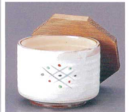
工398-39-2 粉引格子飯器(蓋付) (φ11.5×9.8cm) ¥1,700 1215323041 工398-310-2 粉引格子飯器(身) (φ10.8×7.8cm) ¥1,400 2115395048