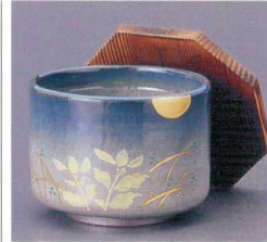
ツ398-13-2 笠間月草花飯器(蓋付) (φ11.5×9cm) ¥2,350 1221323015 ツ398-14-2 笠間月草花飯器(身) (φ10.5×8cm) ¥2,070 2121395016