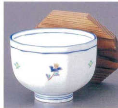
セ398-35-2 小花十二角飯器(蓋付) (11.6×10.5cm) ¥1,750 2032412035 セ398-36-2 小花十二角飯器(身) (11.6×8.4cm) ¥1,400 2032412043