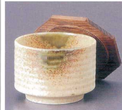
テ398-47-2 伊賀織部飯器(小) (φ10.7×7.7cm) ¥1,500 2211398047 テ398-48-2 伊賀織部焼杉蓋 (11.6×11.6×1.7cm) ¥650 2211398048