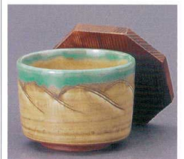
工398-25-2 灰釉織部流し飯器(蓋付) (φ10.5×10cm) ¥1,800 2215398025 工398-26-2 灰釉織部流し飯器(身) (φ10.5×7.8cm) ¥1,540 2215398026