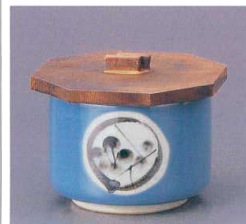
チ398-57-2 ブルー丸紋飯器(蓋付) (φ10.8×9.7cm) ¥1,400 1208323045 チ398-58-2 ブルー丸紋飯器(身) (φ10.8×7.7cm) ¥1,150 2108396110