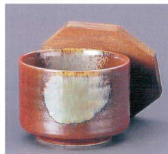
ヒ398-55-2 伊賀風飯器(蓋付) (11.5×11.5×9.2cm) ¥1,450 2017413014 ヒ398-56-2 伊賀風飯器(身) (φ10.5×7.6cm) ¥1,200 2117396016