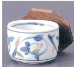
フ398-45-2 色唐草飯器(蓋付) (φ11.5×9.6cm) ¥1,520 2109396023 フ398-46-2 色唐草飯器(身) (φ11×8cm) ¥1,280 2109396024