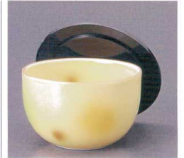
ケ398-15-2 あすか三色飯器(蓋付) (φ12×8cm) ¥2,100 1430345033 ケ398-16-2 あすか三色飯器(身) (φ10.9×7cm) ¥1,700 1430345034