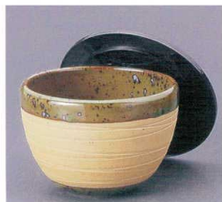
ワ398-51-2 無釉鉄吹ヨモギ姫井(蓋付) (φ12×8.9cm) ¥1,460 1809417052 ワ398-52-2 無釉鉄吹ヨモギ姫井(身) (φ11×7.7cm) ¥1,200 1809417056