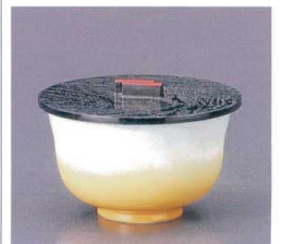
ツ398-59-2 茶吹ぼかし飯器(蓋付) (φ12×8cm) ¥1,370 2021413016 ツ398-510-2 茶吹ぼかし飯器(身) (φ11×7cm) ¥1,100 2021413017