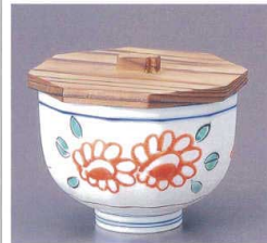
セ398-37-2 赤画花十二角飯器(蓋付) (11.6×10.5cm) ¥1,750 2032412042 セ398-38-2 赤画花十二角飯器(身) (11.6×8.4cm) ¥1,400 2032412036