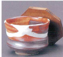
カ398-41-2 残雪飯器(蓋付) (φ11×10.5cm) ¥1,650 1414345052 カ398-42-2 残雪飯器(身) (φ11×8cm) ¥1,380 1614341032