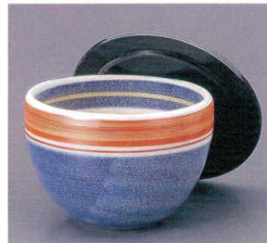
フ398-33-2 呉須朱卷姫井(蓋付) (φ12×8.9cm) ¥1,760 1809417057 フ398-34-2 呉須朱卷姫井(身) (φ11×7.7cm) ¥1,500 1809417051