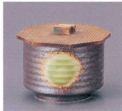
ル398-31-2 備前ヒワ吹蓋付飯器 (φ11.5×9.4cm) ¥1,900 2205398031 ル398-32-2 備前ヒワ吹飯器(身) (φ10.5×7.7cm) ¥1,650 2205398032