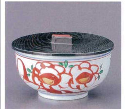
工398-49-2 赤絵草花(笹)飯器(蓋付) (φ13.5×8.2cm) ¥1,460 1215323042 工398-410-2 赤絵草花(笹)飯器(身) (φ12.7×6.7cm) ¥1,200 2115395410