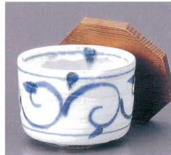
工398-43-2 粉引唐草飯器(蓋付) (φ11.5×10cm) ¥1,950 2015412041 工398-44-2 粉引唐草飯器(身) (φ11.2×7.8cm) ¥1,650 2115395037