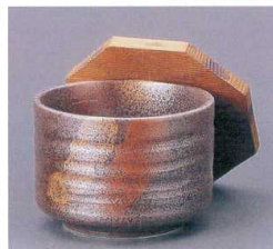
ヒ398-53-2 備前風飯器(蓋付) (11.5×11.5×9.2cm) ¥1,450 2017413012 ヒ398-54-2 備前風飯器(身) (φ10.5×7.6cm) ¥1,200 2117396018