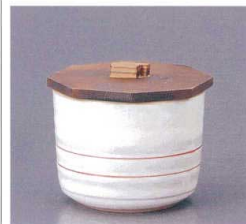
工398-23-2 駒筋飯器(蓋付) (φ10.1×9.5cm) ¥2,000 2115395045 工398-24-2 駒筋飯器(身) (φ9.8×7.5cm) ¥1,740 2115395046