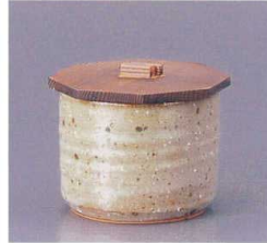
工398-11-2 灰釉飯器(蓋付) (φ10.1×9.2cm) ¥2,800 2115395021 工398-12-2 灰釉飯器(身) (φ9.6×7.4cm) ¥2,500 2115395022