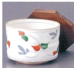
工398-21-2 赤画唐草飯器(蓋付) (φ11.5×10cm) ¥2,000 1215323032 工398-22-2 赤画唐草飯器(身) (φ10.4×7.9cm) ¥1,700 2115395026