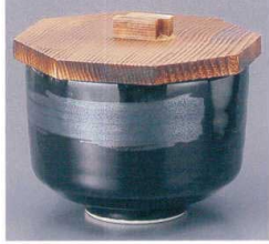
工399-21-2 銀彩刷毛筒型飯器蓋付 (φ11.5×9.8cm) ¥1,200 2215399021 工399-22-2 銀彩刷毛筒型飯器身のみ (φ10.7×7.7cm) ¥900 2215399022