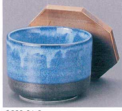
チ399-31-2 流釉飯器(蓋付) (φ10.8×10cm) ¥1,100 2008413021 チ399-32-2 流釉飯器(身) (φ10.8×8cm) ¥850 2108396042