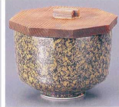
工399-17-2 錦天目筒型飯器蓋付 (φ11.5×9.8cm) ¥1,200 2215399017 工399-18-2 錦天目筒型飯器身のみ (φ10.7×7.7cm) ¥900 2215399018