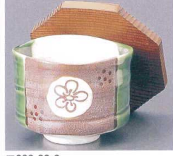
工399-33-2 織部茶流し飯器(蓋付) (φ11.5×9.6cm) ¥1,100 2015413032 工399-34-2 織部茶流し飯器(身) (φ10.5×7.7cm) ¥800 2115396032