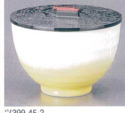
ツ399-45-2 黄吹飯器(蓋付) (φ12×9cm) ¥820 2021413046 ツ399-46-2 黄吹飯器(身) (φ11.5×8cm) ¥550 2021413047