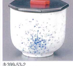
キ399-53-2 吹墨測金姫飯器 (φ9×8cm) ¥1,200 2113396029 (中国製)