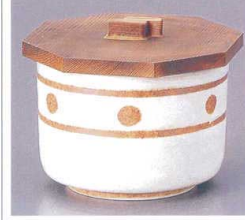
チ399-27-2 水玉飯器(蓋付) (φ10.8×10cm) ¥1,100 2208399027 チ399-28-2 水玉飯器(身) (φ10.8×8cm) ¥850 2208399028