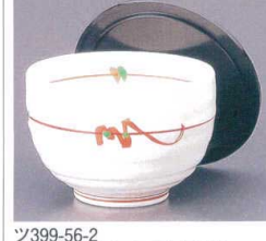
ツ399-56-2 粉引赤絵ほんのり碗(蓋付) (11.2×8.2cm) ¥1,030 2221399056 ツ399-57-2 粉引赤絵(身) (10.2×7.2cm) ¥780 2221399057