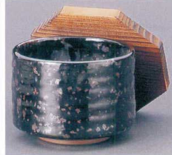
工399-15-2 あられ天目飯器(蓋付) (φ11.5×9.5cm) ¥1,260 2015413011 工399-16-2 あられ天目飯器(身) (φ10.3×7.5cm) ¥1,000 2115396026