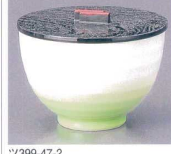
ツ399-47-2 グリーン暈飯器(蓋付) (φ12×9cm) ¥820 2021413048 ツ399-48-2 グリーン暈飯器(身) (φ11.5×8cm) ¥550 2021413049