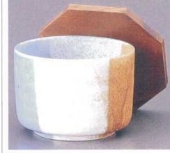
チ399-29-2 四色掛飯器(蓋付) (φ10.8×10cm) ¥1,100 1808417034 チ399-210-2 四色掛飯器(身) (φ10.8×8cm) ¥850 2108396310