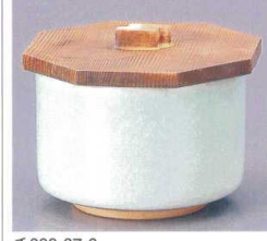
チ399-37-2 べ入飯器(蓋付) (φ11×10cm) ¥1,050 1208323054 チ399-38-2 べ入飯器(身) (φ11×8cm) ¥800 2108396044