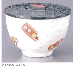
ツ399-41-2 赤刷毛散飯器(蓋付) (φ12×9cm) ¥970 2021413041 ツ399-42-2 赤刷毛散飯器(身) (φ11.5×8cm) ¥700 2021413042