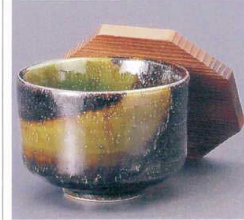
工399-19-2 黒唐津オリベ流筒型飯器蓋付 (φ11.5×9.8cm) ¥1,200 2215399019 工399-110-2 黒唐津オリベ流筒型飯器身のみ (φ10.7×7.7cm) ¥900 2215399110