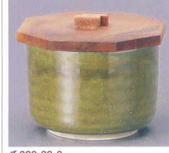
チ399-39-2 織部飯器(蓋付) (φ10.8×10cm) ¥1,050 1208323053 チ399-310-2 織部飯器(身) (φ10.8×8cm) ¥800 2108396046