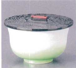
ツ399-11-2 ヒワ吹 ぼかし飯器(蓋付) (φ12×8cm) ¥1,370 2021413018 ツ399-12-2 ヒワ吹 ぼかし飯器(身) (φ11×7cm) ¥1,100 2021413019