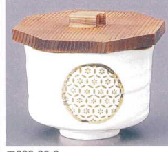
工399-35-2 丸紋白貫入飯器(蓋付) (φ11.5×9.8cm) ¥1,100 2015413031 工399-36-2 丸紋白貫入飯器(身) (φ10.3×7.8cm) ¥800 2115396034