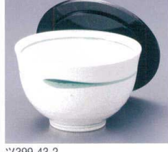
ツ399-43-2 グリーン文字飯器(蓋付) (φ12×8.8cm) ¥920 2021413044 ツ399-44-2 グリーン文字飯器(身) (φ11.5×7.8cm) ¥650 2021413045