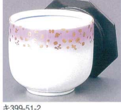
キ399-51-2 紫吹金箔姫飯器 (9×8cm) ¥1,900 2013413053 (中国製)