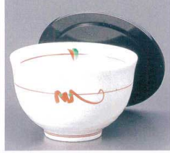
ツ399-23-2 粉引錦若草飯器(蓋付) (φ12×8.5cm) ¥1,150 1621341057 ツ399-24-2 粉引錦若草飯器(身) (φ11.5×7.5cm) ¥880 1621341058