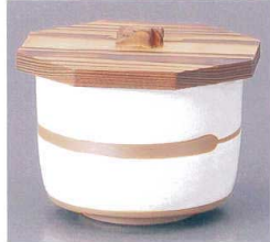
セ399-13-2 茶筋飯器(蓋付) (φ10.8×10cm) ¥1,350 2132396021 セ399-14-2 茶筋飯器(身) (φ10.8×7.5cm) ¥930 2132396022