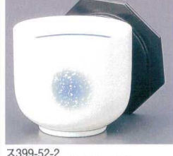
ス399-52-2 三色吹測金姫飯器蓋付 (φ9×8cm) ¥1,550 2026413055 (中国製)