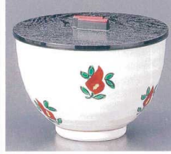
ツ399-25-2 若小花飯器(蓋付) (φ12×9cm) ¥1,120 2021413036 ツ399-26-2 若小花飯器(身) (φ11.5×8cm) ¥850 2021413037