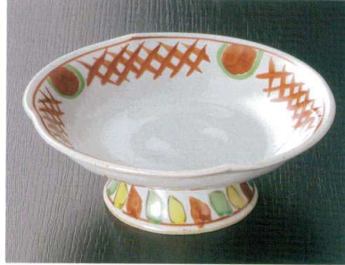
キ40-12-2 赤絵 高台鉢(大) (φ15×5.5cm) ¥2,100 1213211024