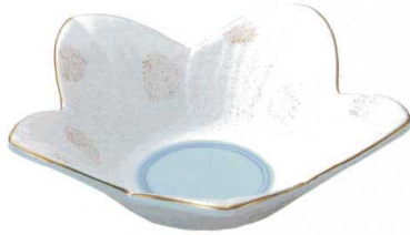
ケ40-11-2 青磁パールラスター 花形中鉢 (16×5cm) ¥2,100 1630034031