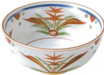
リ40-31-2 赤絵三方花 丸中鉢 (φ12.2×5.6cm) ¥2,000 2129031041