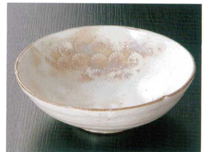
キ40-43-2 手造り印花 浅鉢 (φ15.5×5cm) ¥1,800 1613028031