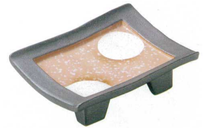
ケ40-33-2 黒土萬月 高台5.0皿 (15.6×11.5×4.4cm) ¥1,850 2030025043