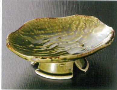
リ40-21-2 織部変型 5.5高台鉢 (16.6×13.5×5.7cm) ¥2,000 2129031021