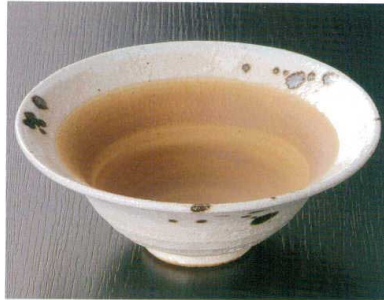
ケ40-32-2 サビ散らし 5.0向付 (φ15.5×5.7cm) ¥1,900 2230040032