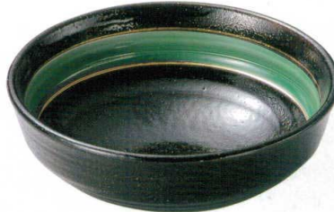
ワ40-22-2 京天目交趾帯 丸鉢 (φ13.7×5cm) ¥2,000 2009033012