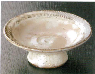
エ40-41-2 粉引クシ目 高台皿 (φ13.5×5.4cm) ¥1,850 2015034021