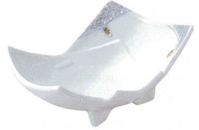
ケ40-13-2 ブルー吹ラスター 重ね小鉢 (17.5×11.5×6.5cm) ¥2,050 2130030013